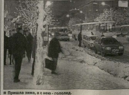
Пришла зима, а с нею – гололед.

Воронежский областной комитет государственной статистики предлагает вашему вниманию сборник «Воронежский статистический ежегодник». Сборник содержит обширную информацию о социально-экономическом положении Воронежской области за последние годы. Помещены данные, отражающие демографические процессы, проблемы занятости и безработицы, социального развития, уровня жизни населения, экологии, развития важнейших отраслей экономики, ход экономических реформ, финансовое состояние предприятий и организаций, динамику цен и тарифов, инвестиционную политику. В «Ежегоднике» представлен обширный материал о социально-экономическом положении областей Центрального Федерального округа. Стоимость издания – 360 рублей. По вопросам приобретения обращаться в Воронежский областной комитет государственной статистики: ул. Плехановская, 23, комната 27, тел. 55-29-93, служба маркетинга.