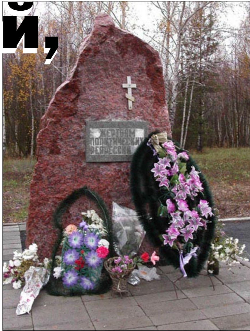
Памятник жертвам политических репрессий в Боброве.

вительно-трудовые лагеря) – 186000 человек. Для размещения последних создавались шесть лесозаготовительных лагерей. На тот момент прошло целых двадцать лет после Октябрьского переворота. Предушущими «зачистками» с антисоветскими элементами было в основном покончено. Но приближались выборы в Верховный Совет СССР. Настроения в обществе не радовали сталинское окружение. Массовый террор, широкомасштабные репрессии, направленные против собственного народа, призваны были стать средством удержания власти.