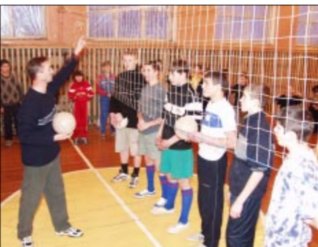
Волейбольная команда Озерской средней школы – лучшая в области.