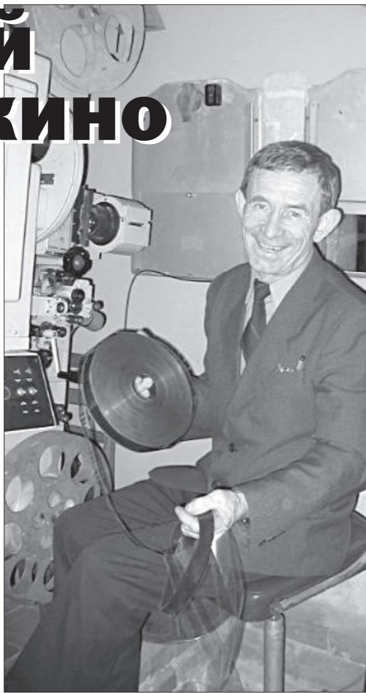
Фото автора. □ Почетный кинематографист России Николай Крупнич.