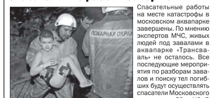
Спасательные работы на месте катастрофы в московском аквапарке завершены. По мнению экспертов МЧС, живых людей под завалами в аквапарке «Трансвалль» не осталось. Все последующие мероприятия по разборкам завалов и поиску тел погибших будут осуществлять спасатели Московского управления ГО и ЧС. В расчистке завалов участвуют 364 спасателя. Кроме того, к работе привлечено 46 единиц спецтехники. Погибшими в результате обрушения кровли в аквапарке числятся 25 человек, 24 тела погибших были найдены под завалами, один человек умер в

больнице. Были ранены 113 человек, 68 из них до сих пор находятся в больницах города. Состояние большинства оценивается врачами как «средней тяжести», среди основных травм — ушибы, переломы, рваные раны и сотрясение мозга. Основная проблема детей — переохлаждение.