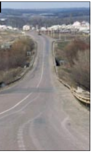
основная часть промышленных и сельскохозяйственных предприятий сегодня попали в руки тех, кто намерен их развивать и стремиться к росту по всем направлениям.

татную зарплату и рос выпуск продукции. К чему весь этот разговор? В Воронежской области собрались с духом и вышли на третий этап — нравится это кому-либо или нет, но законы рыночной экономики. Наши соотечественники пытаются сделать этот шаг, либо под давлением местных элит не собираются этого делать вовсе. Хочу рассказать об одном примечательном моменте. Исторически сложилось, что Воронежский агроуниверситет готовит специалистов для Воронежской и Липецкой областей. В течение ряда лет доводилось присутствовать на так называемых «покупках» выпускников — обычно, всегда прибывает огромная делегация личин на главе с начальником управления сельского хозяйства или его заместителем плюс представители всех (!) районов. Выпускникам обещается высокая зарплата, решение квартирных проблем и делается упор на постоянную огромную (по сравнению с Воронежской областью) бюджетной поддержке села (десять, проблем не будет) и... стидливо умалчивается об огромном количестве убыточных хозяйств. В последний раз и мы выглядели вовсе не бледно — да,