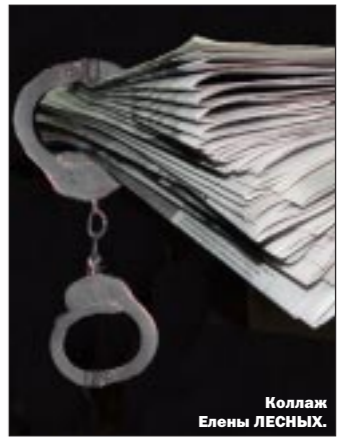
Коллаж Елены ЛЕСНЫХ.