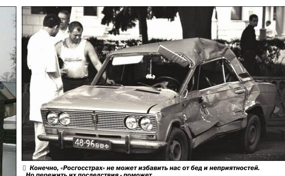
Конечно, «Росгосстрах» не может избавить нас от бед и неприятностей. Но пережить их последствия – поможет.

То же самое, кстати, относится и к руководителям солидных организаций. Например, дорожных. Ведь тогда же, весной прошлого года, в Кантемировке был размыт участок дороги Воронеж – Луганск. Если бы дорога была застрахована, то компенсацию ущерба взыскали бы на себя страховая компания. Но вместо этого дорожники, да и областные власти пришлось с протянутой рукой не раз обращаться в столицу. Но опять же и этот урок мало чему научил хозяйственников. Тем не менее страховое дело и в Воронежской области набирает силу. «Росгосстрах» буквально на глазах превращается в современную, работающую по мировым стандартам компанию – лидера на страховом рынке России.