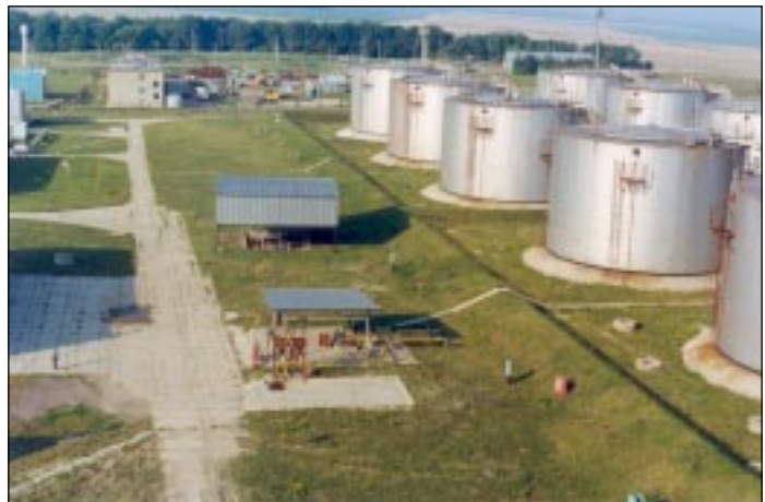
Общий вид резервуарного парка ЛПДС «Белгород».

– И у нас есть такие. Актуальными остаются вопросы диагностики и ремонт линейной части нефтепродуктопроводов, а самое главное, оперативного обнаружения естественных утечек и несанкционированных врезок с целью хищения бензина. Чем быстрее мы будем справляться с подобными внезапно возникающими ситуациями, тем в меньшем убытке окажемся.