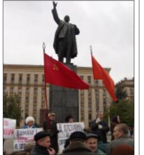
Скоро подобное станет незаконным.

Никто из воронежцев не предполагал, что обычный крикливый и малодетственный митинг рыночных торговцев 30 марта возле здания мэрии войдет в историю города.