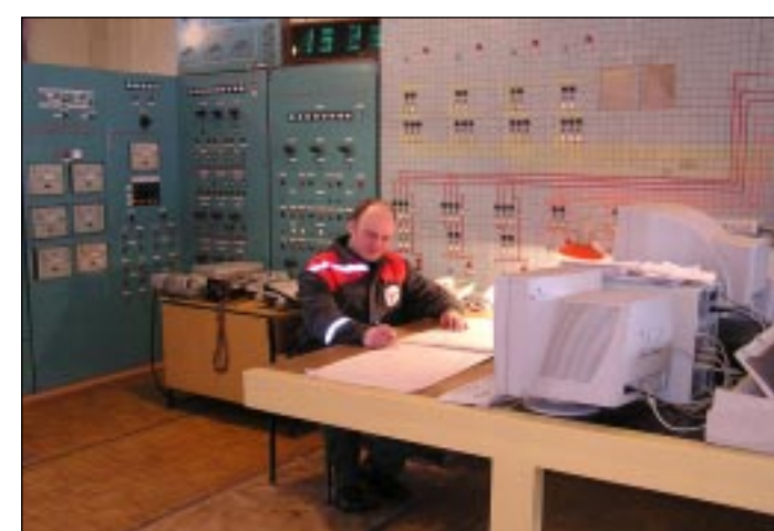
Главный пульт управления ЛПДС «Воронеж».

Сегодня объем потребления светлых нефтепродуктов в Воронежской области составляет более 1,2 млн. тонн, а по трубопроводам поступает только 0,6 млн. тонн. Промышленность и сельское хозяйство теряют ежегодно миллионы рублей только из-за того, что тарифы на перевозку нефтепродуктов по железной дороге гораздо выше, чем при перекачке по