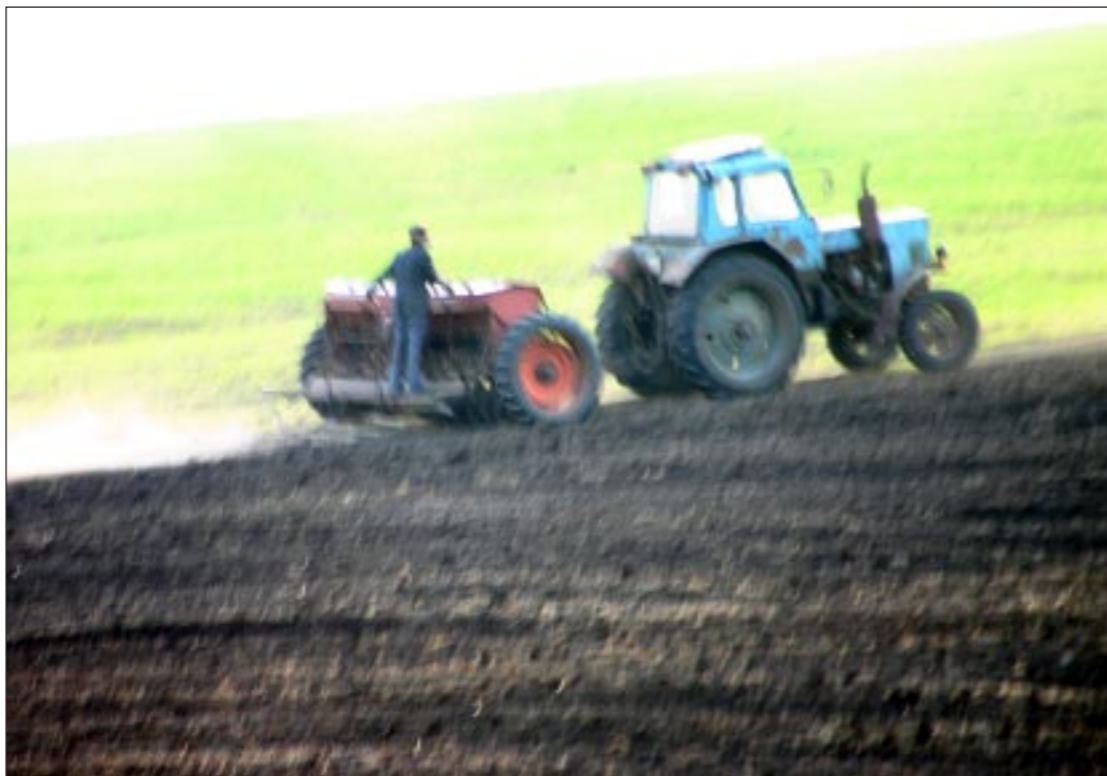
Весна. В лесополосе вдоль Дона уже цветет ива. А рядом на взгорке рожочет трактор. На полях ЗАО «Гремячское» Хохольского района полным ходом идет посевная.