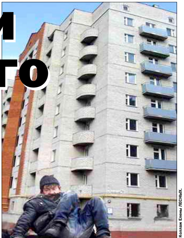
БОМЖ (бывший обитатель муниципального жилья).

Приватизируя жилье, люди вынуждены месяцами обивать учрежденческие пороги, добывать десятки лишних справок.