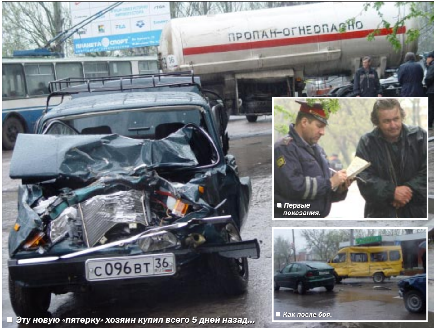
Эту новую «пятерку» хозяин купил всего 5 дней назад...

За первые три месяца 2004 года в Воронежской области совершено 441 дорожно-транспортное происшествие , что ровно на 100 ДТП больше, чем за такой же период прошлого года. Прирост числа ДТП составил 29,3 процента. В них 72 человека погибли (рост – 9 процентов) и 513 – ранены (рост 34,6 процента).