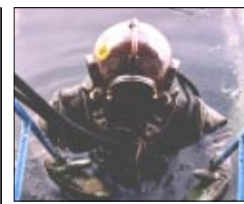
Воронежская водолазная школа РОСТО расположена за сотни километров от ближайшего, Азовского, моря, но в точке рождения Российского флота, 65 лет здесь свято чтят и преумножают военно-морские традиции страны.

Акционерами ОАО «Газпром» являются около 500 тысяч физических и юридических лиц. Они живут и работают во всех регионах России, зачастую на расстоянии нескольких тысяч километров от места проведения собрания. Участие акционеров в собраниях через представителей позволяет акционеру максимально полно реализовать свое право на участие в управлении обществом и выразить свою волю на общем собрании.