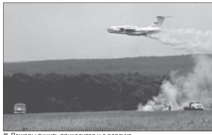
Пожары тушить приходится и с воздуха.