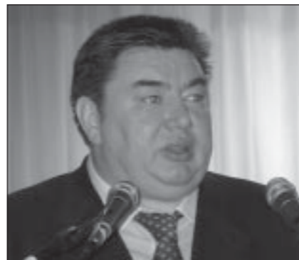
Первый вице-президент ОАО «РЖД» Хасян Забиров.

Названные отрасли ориентируются на поставку сырья. В основном - за границу. Железнодорожники - чистые производственники, они возят грузы и пассажиров, то есть работают на отечественную экономику и, тем не менее, ОАО «РЖД» имеет дефицитный, рентабельный финансовый план. Будем работать - будет и зарплата! Есть предложения, что она и впрямь будет расти быстрыми темпами. Кстати, зарплата растет не за счет пресловутого сокращения кадров. Даже в условиях жесткого реформирования, Юго-Восточная железная дорога увеличила число рабочих мест. По сравнению с прошлым годом полку железнодорожников прибыло -