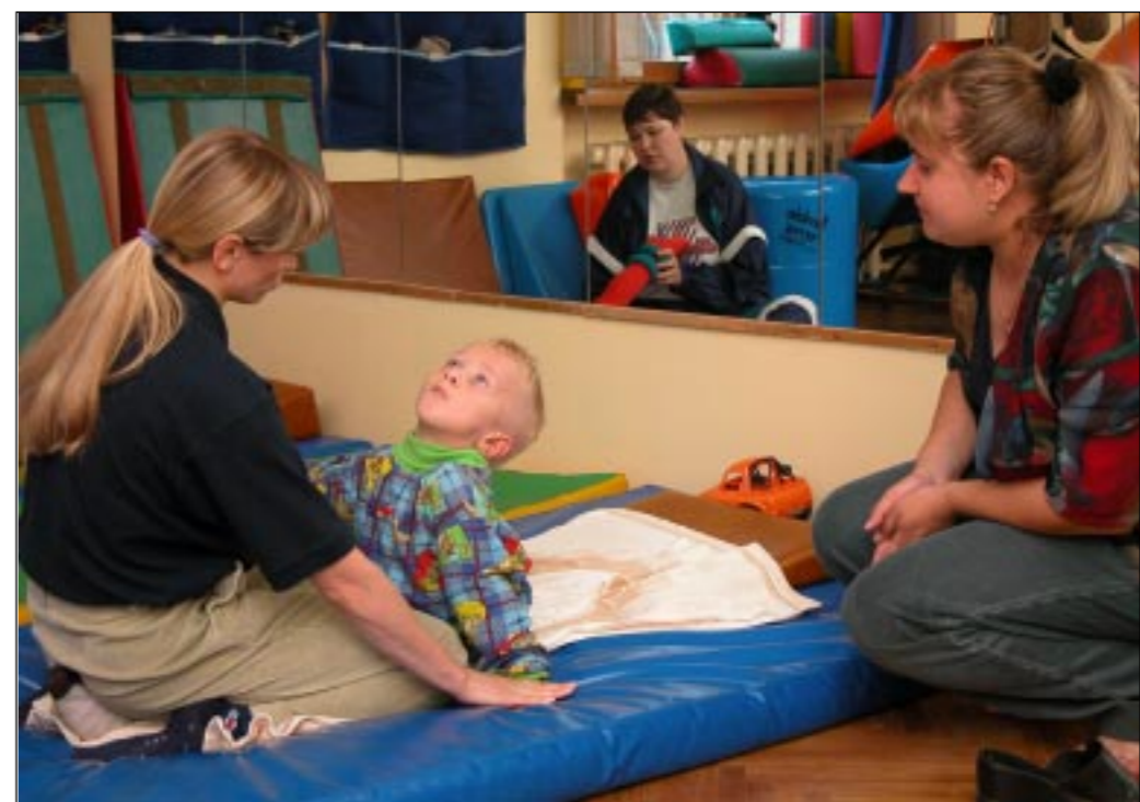
В реабилитационном центре «Парус надежды».