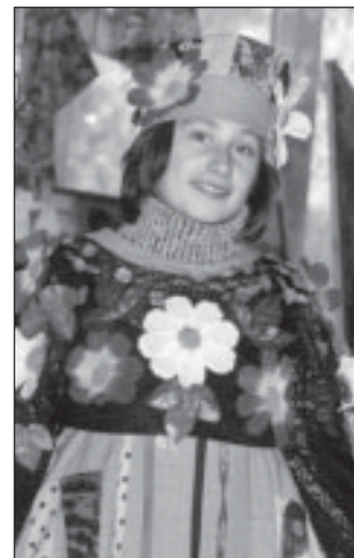
заметной участницей последней выставки, демонстрируя собственноручно сшитый яркий народный костюм.

Главное управление труда и социального развития администрации Воронежской области ежегодно устраивает накануне своего профессионального праздника в областном центре социальную помощь семье и детям «Буревестник» масштабную выставку творческих работ, авторами которых являются временные питомцы реабилитационных центров для безнадзорных детей. В области действуют 24 таких центра, в которых подросткам предоставляют убежище от жизненных неурядиц, создают условия для развития их творческих способностей. Как правило, на выставку в «Буревестнике» со всех районных центров привозят до 200 самых разнообразных работ. Юные творцы сами представляют свои работы зрителям.