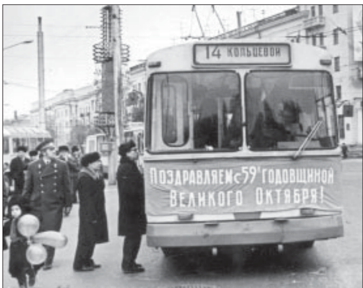
■ 1976 год. Пущен кольцевой троллейбусный маршрут, связавший правый и левый берег.