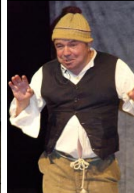
Народный артист России Анатолий Абдулаев.