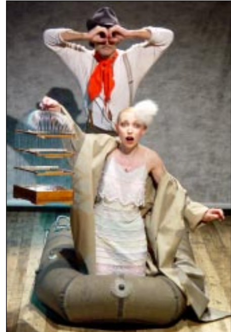
Фрагмент юбилейного концерта.