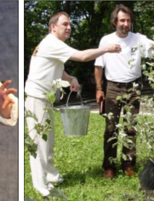
Посадка деревьев в память о десятилетии Камерного театра.