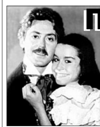
Кадр из фильма.

В конце беседы бывшая Мальвина достала из гардероба бережно хранимые маленькие туфельки, шитые на заказ, и то самое платьице из атласа и кружев, в котором она сыграла свою первую и последнюю роль - девочку с голубыми волосами. Живы до сих пор не только воспомина-