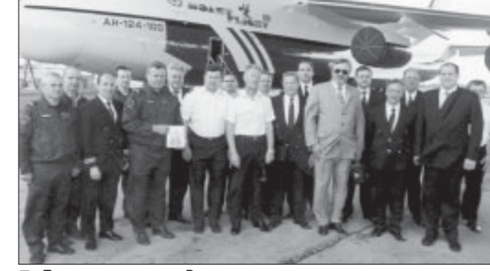
«Полетовцы» новым «Русланом» довольны.