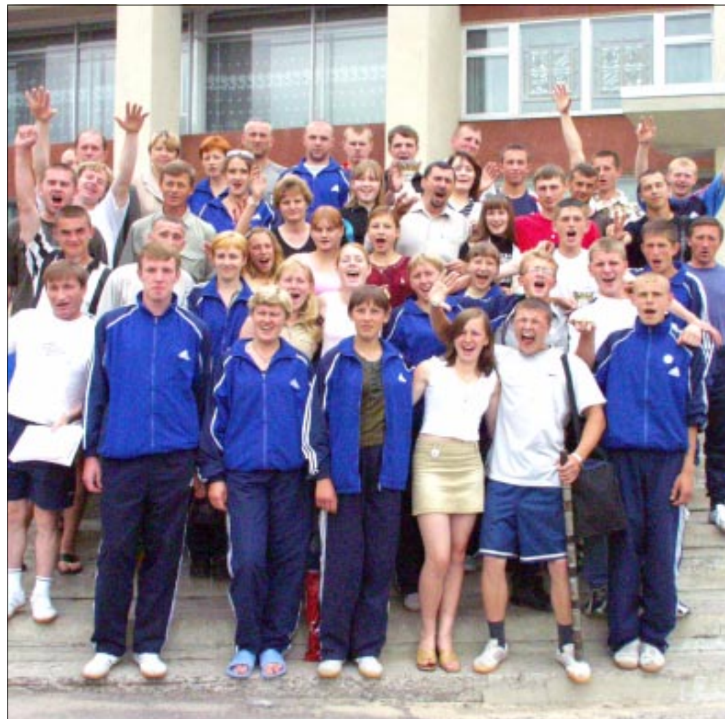
Победители - спортсмены Лискинского района.