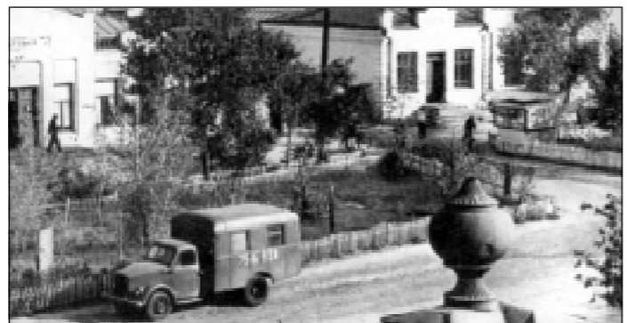
В 50-е годы преобразилась Воронцовка Павловского района.