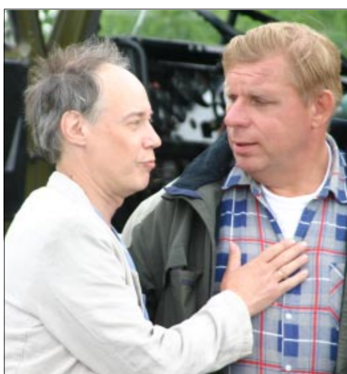
Популярные актеры Владимир Конкин и Александр Пятков.