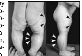
Подготовила Наталия СЕДЫХ.

В Германии родился мутант – супермалышок невиданной силы, возможно, будущий «супермен». Медицинское исследование подтвердило после анализа ДНК мальчика, что это первая подобная мутация. Вследствие генетических изменений мускулы родившегося в Берлине мальчика вдвое превосходят по размеру мускулы обычных людей. Ему нет еще 5 лет, а он уже спокойно удерживает на вытянутых руках 3-килограммовые гантели. Такое не каждому взрослому под силу. Ученые полагают, что, исследовав «супермена», они смогут помочь страдающим мышечной дистрофией и другими похожими расстройствами. Спортсменам также будет довольно сложно удерживать его от того, чтобы вложить себе в руку пару кубиков волшебного мышечного эликсира. Врачам удалось установить, что благодаря странной мутации ДНК блокировала производство белка миостатина, который ограничивает рост мышц. Еще семь лет тому назад ученым из Университета Джона Хопкинса в Балтиморе удалось вырастить «могучую мышь», блокировав ей производство миостатина, однако на людях провести подобные эксперименты было невозможно. «Теперь мы можем сказать, что миостатин действует на людей так же, как и на животных. И мы можем применить это знание на благо людей», – утверждает врач, обследовавший мальчика, профессор Маркус Шульце.