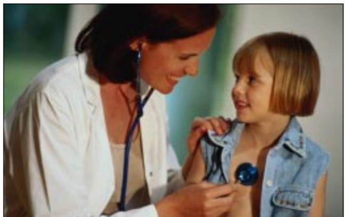
когда напряжение в приемном отделении несколько спало.

– Как часто к вам поступают больные с подобными травмами? – спрашиваю я доктора,