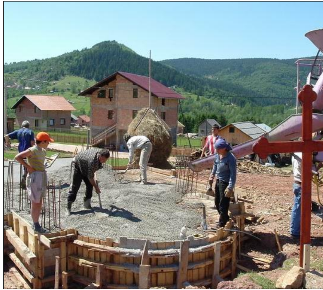
Закладывается фундамент церкви.