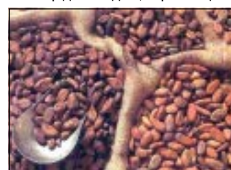
Подготовила Наталия СЕДЫХ.