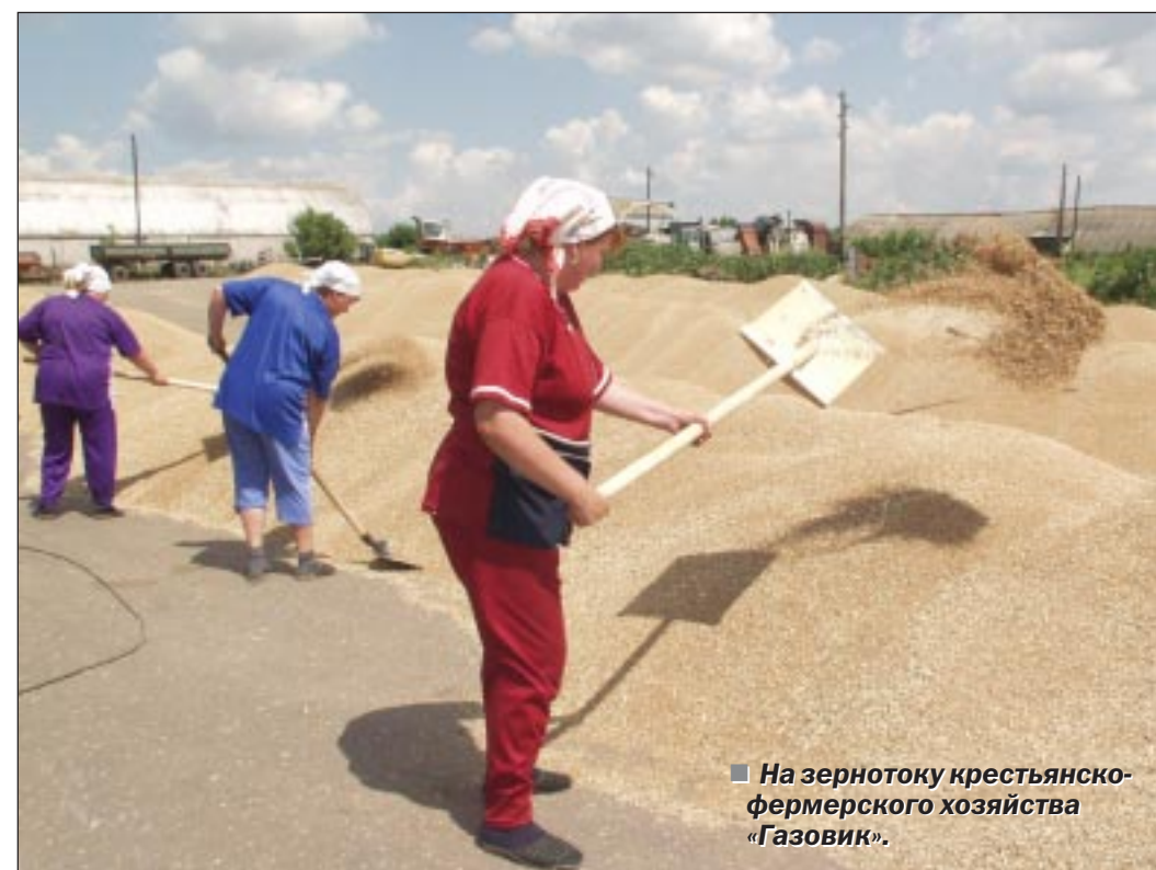
На зернотоку крестьянско-фермерского хозяйства «Газовик».