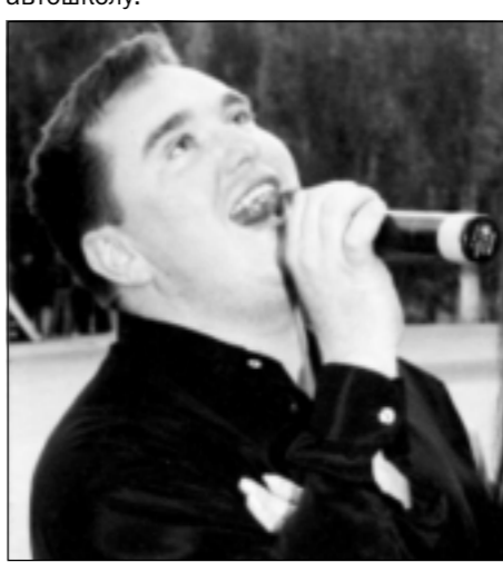
Вызывали в военкомат. Поздравляли. - Награжден орденом Мужества. Где будем вручать?

Ни к чему мне Божья благодать, Мама, на земле я был и не был. И теперь не в силах я подняться Назвничь опрокинутое небо.