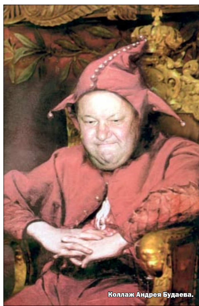
Коллаж Андрея Будаева.

помимо большого холла, переходящего в гостиную, были еще две спальни, кабинет главы семейства, комната дочери Татьяны и ее тогда второго мужа, Леша. Восемьметровая комната маленького Бори, внука, в счет не шла.