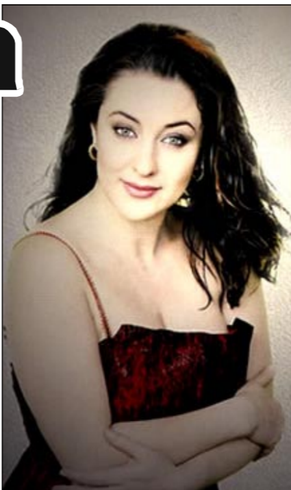
Имя люди чаще всего связывают с одной-единственной песней «Виват, король!»

- У меня нет цели стать еще более известной, чем я есть. Знаете, пишу про некоторых: «известный композитор такой-то», «известный художник такой-то». Но никому и в голову не придет написать напротив фамилии Пикассо - «известный художник». Пикассо - и так всем понятно. Понимаете? Я счастлива, что в огромной России у меня, человека из маленькой страны, с фамилией, которую многие и произнести не могут, есть что одна песня, которую знают все. Поверьте, уж если бы мне, пережившей столько революций, захотелось иметь в своем репертуаре еще несколько шлягеров, мне бы это удалось.