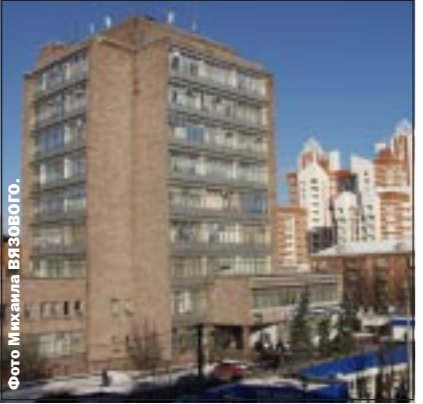
НИИСвязи — главный в «Созвездии».