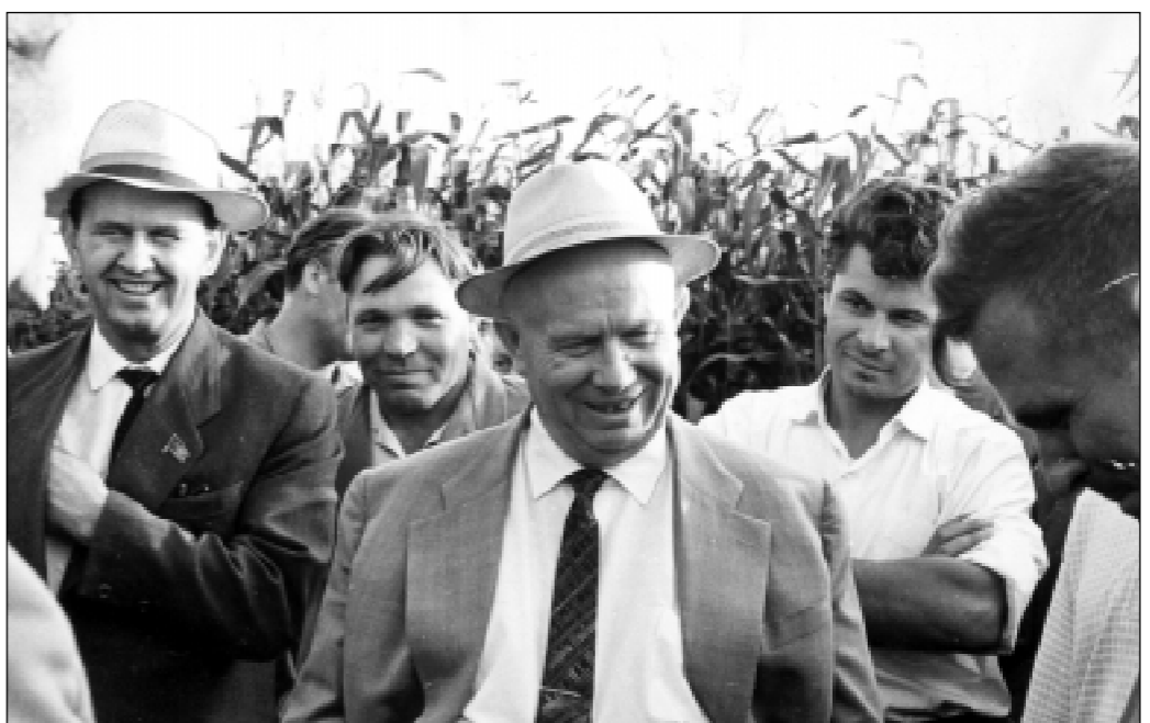
Н.С.Хрущев с воронежскими кукурузоводами.

В Воронежском государственном цирке с огромным успехом проходит выступление выдающегося клоуна Карандаша (Михаила Румянцев).