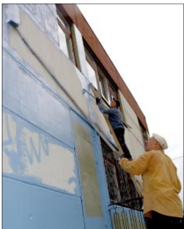
МЫ И ПРИРОДА