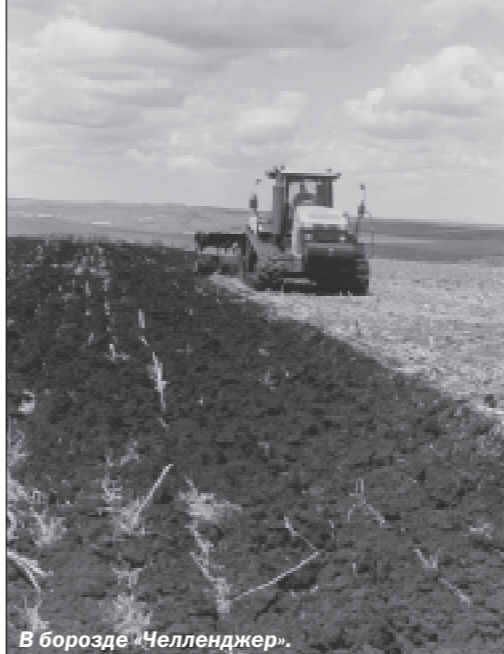
В борозде «Челленджер».

И пытаясь уполоскнуться, завоуж разговор о сенокосе. А Сенька мне просубу ребром.