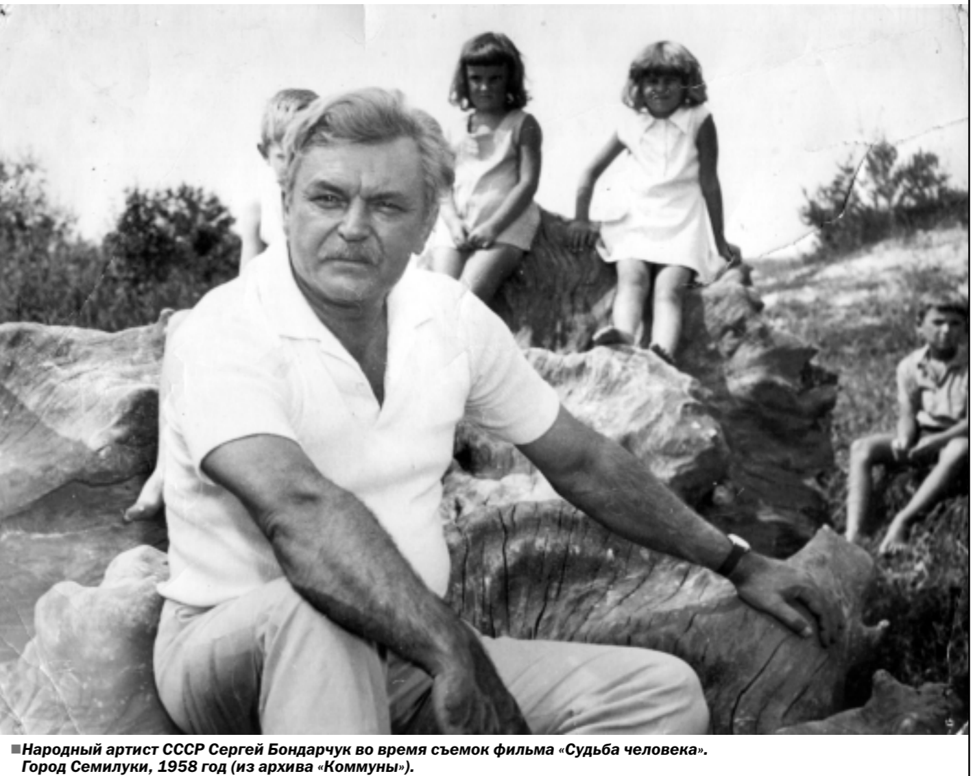
Народный артист СССР Сергей Бондарчук во время съемок фильма «Судьба человека». Город Семилуки, 1958 год.

Бурный двадцатый век не обошел событийной стороной наш Воронеж. Так или иначе, но многие значительные политические, историко-культурные события остались запечатленными на снимках. Одни из них хранятся в музеях и государственных архивах, другие – в домашних фотоальбомах и частных коллекциях. Но те и другие ждут своего часа быть обнародованными. Ведь в них – наша история. «Коммуна» открывает на своих страницах новую рубрику – «Памятная встреча» и ждет снимки наших читателей.