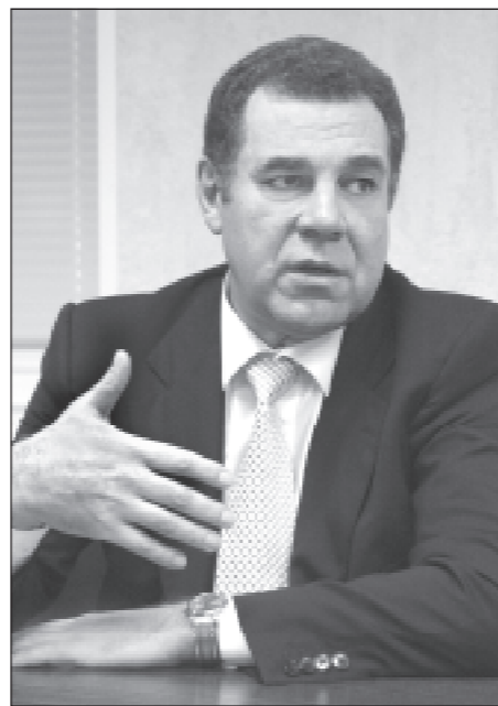
Бой руководитель готов тебе платить.

А вот работать-то, к великому нашему сожалению, на селе сегодня никому. И не потому, что крестьяне разучились работать. А, прежде всего, потому, что перспективные молодые кадры уехали из села в город учиться. Но я вам могу сказать, что всего полтора процента уехавших в город возвращаются в село. Село стремительно стареет, и та молодёжь, которая сегодня осталась в селе — хорошая молодёжь, часть её нормально работает, а даже могу сказать — большая половина, но остальные, те, кто не желает работать, становятся халхалками. Пьянство просто захлестнуло село, пьянство и воровство. И не поймёшь, вроде бы, хочешь жить хорошо — иди работать, вот, есть же у тебя техника сегодня, у тебя есть хорошая зарплата, если ты будешь работать. Так нет — это же ведь надо напрягаться. Вот этому сегодня приходится уделять особое внимание. И когда нас начинают обвинять, что мы даем разрешение на иностранную рабочую силу, приезают к нам работать и молдаване, и азербайджанцы, даже турки, и порой в прессе раздаются возмущённые крики: что же вы делаете, наши-то люди тоже должны работать. Но я вам отвечаю: наши люди не идут работать. Приходит человек устраивается, и первый вопрос: а сколько вы мне будете платить? Нормальный вопрос, да? Я всегда на этот вопрос отвечаю так: давай сначала посмотрим, а что ты умеешь делать. И если ты доказываешь, что ты умеешь что-то делать, что ты нормальный работник, то лю-