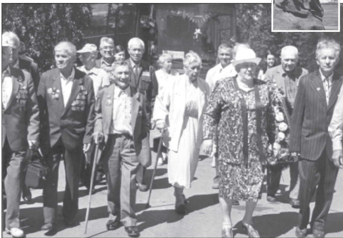
Нововоронежские ветераны в Волгограде.