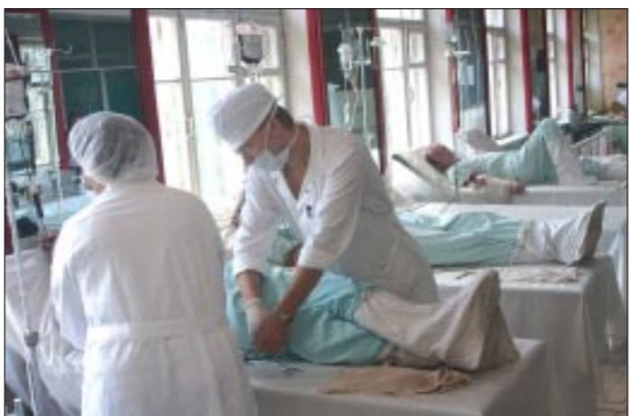
Этот снимок фотокорреспондент «Коммуны» Михаил Вязовой сделал вчера на областной станции переливания крови.

Мы готовы помогать коллегам из Москвы или любого другого региона, где будут лечиться пострадавшие дети и взрослые. Отправим им столько белковых препаратов крови, сколько потребуется. Утром в понедельник мне позвонили из профкома Воронежской медакадемии и сказали, что около трехсот студентов собираются идти к нам сдавать кровь.