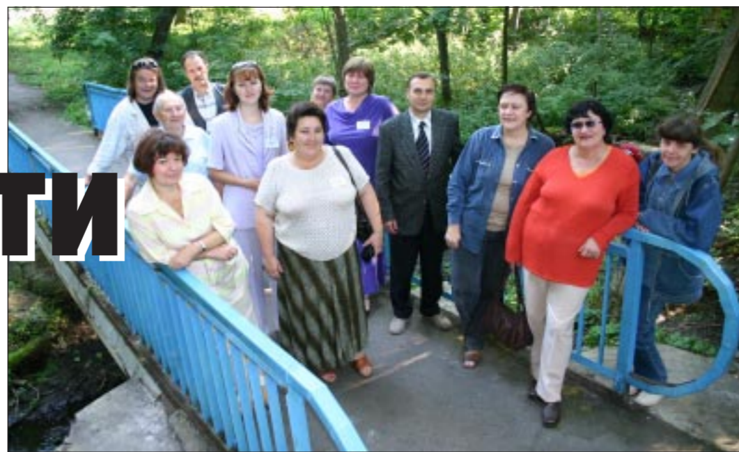
На знаменитом Никольском мостике - участники фестиваля.