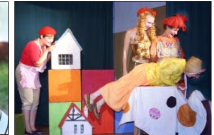
Сцена из спектакля «Бешеная семья».