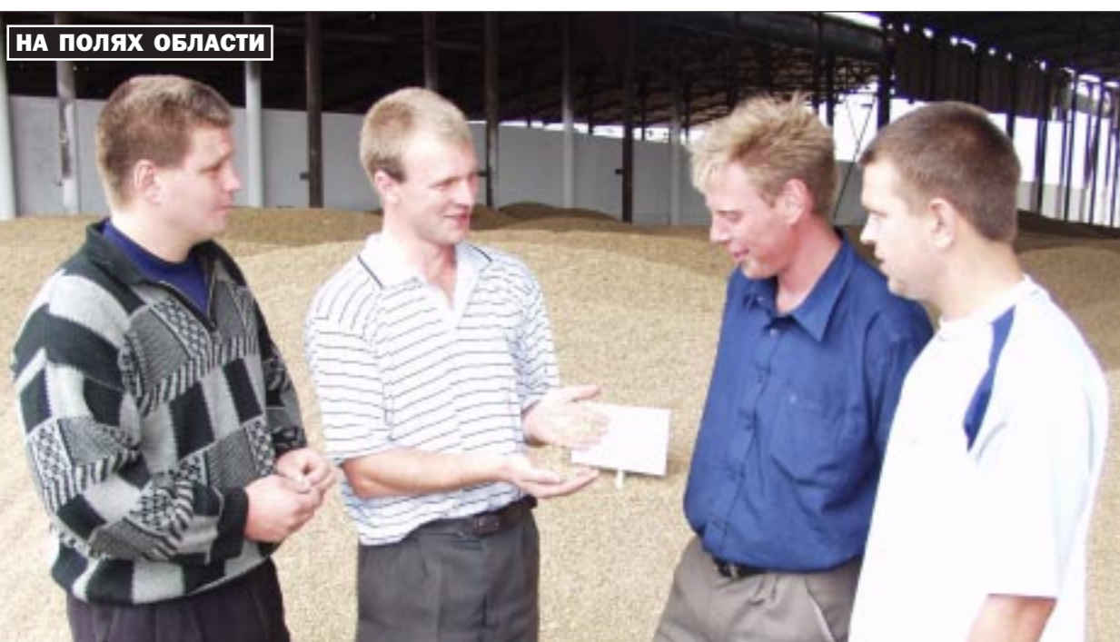
На полях области Как не просто производить больше зерна, но и добиваться того, чтобы оно всегда было отличного качества и пользовалось большим спросом на рынке? Ответ на этот вопрос, становящийся все более актуальным для вороничских земледельцев, подсказывают в ЗАО «Давыдовское» Лискинского района. В этом семеноводческом хозяйстве уже много лет производят элитные семена озимой пшеницы, ячменя, других культур.

Депутаты Воронежской городской Думы обратились с призывом ко всем политическим партиям, движениям, общественным организациям, профсоюзам, религиозным деятелям, всем вороничам провести в воскресенье, 12 сентября, массовый митинг протеста против террора. Малый совет гордумы поручил администрации Воронежа организовать и провести данный митинг на площади Ленина, попросил руководителей правоохранительных органов обеспечить безопасность вороничцев при проведении этой акции.