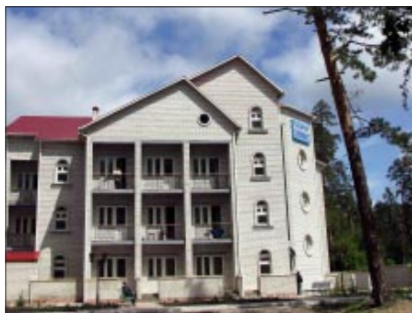
Новый лечебный корпус.

В России лишь 4 или 5 здравниц, где используется этот кисломолочный продукт. Приготовление его - дело хлопотное, но главный врач Тамара Ивершина всеми силами старается поставить дело на своеобразную промышленную основу. Кумыс готовят из парного молока и закваски. Лечебные свойства кумыса проявляет в течение первых трех суток с момента приготовления. В нем образуются особые антибактериальный элемент, который задерживает рост туберкулезной палочки. На четвертые сутки в кумысе остаются свойства лечебного напитка, который улучшает обмен веществ, быстро расщепляет белки, жиры и углеводы, нормализует работу желудочно-кишечного тракта, тонизирует сердечно-сосудистую и нервную системы. Напиток содержит природные антибиотики, ферменты, микроэлементы, витамины А, В 1 , В 2 , В 12 , Д, Е, С. Словом, клад для больного человека.