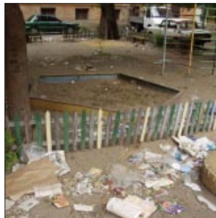
Воронежский «коммунальный» пейзаж.