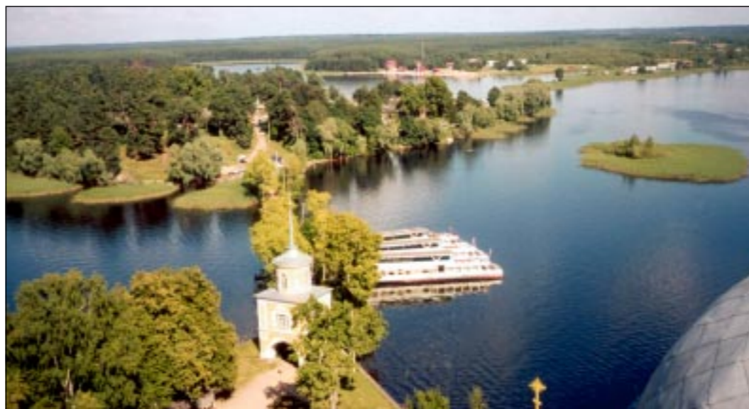
Вот она, ширь Селигера.

Дорога нас изрядно потрепала: почти сутки в поезде, три часа в автобусе, переходы с вокзала на вокзал с неподъемными рюкзаками, жара... Уф-ф! Мы начинаем напоминать сдвигшиеся воздушные шары, «вянем» на глазах. Но первый, кого мы видим между осен, подъезжая к фестивальному лагерю, - Визбор. Улыбается он нам с огромного портрета: такой домашний, родной, в рубашке клетчатой. Высыпаем из машины и попадаем в объятия организаторов: - Ребята, вы герои! Вы у нас самые дальние и самые южные. Кто-то подхватывает наши сумки. В столовой нам уже разливают борщ. Усталости, как не бывало. И - закрылось!.. Концерт открытия, потом ночной костер памяти Визбора. Только в полночь появляется свободное время, и мы всей гурьбой «падаем» в озеро. Ну, здравствуй, Селигер Селигерович! Привет тебе из Воронежа.