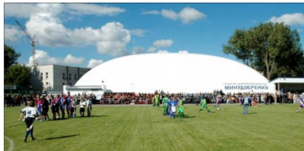
Новый легкоатлетический манеж в Россоши.

Из манежа асфальтированная дорожка ведет к откры-