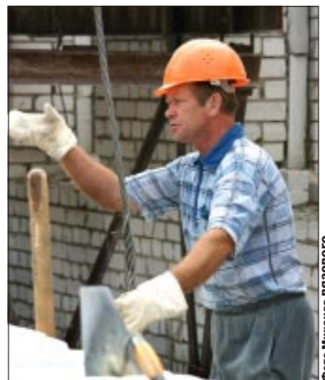
Строители «Сервисмонтажстрой» возводят стоматологическую поликлинику в Северном жилом микрорайоне.