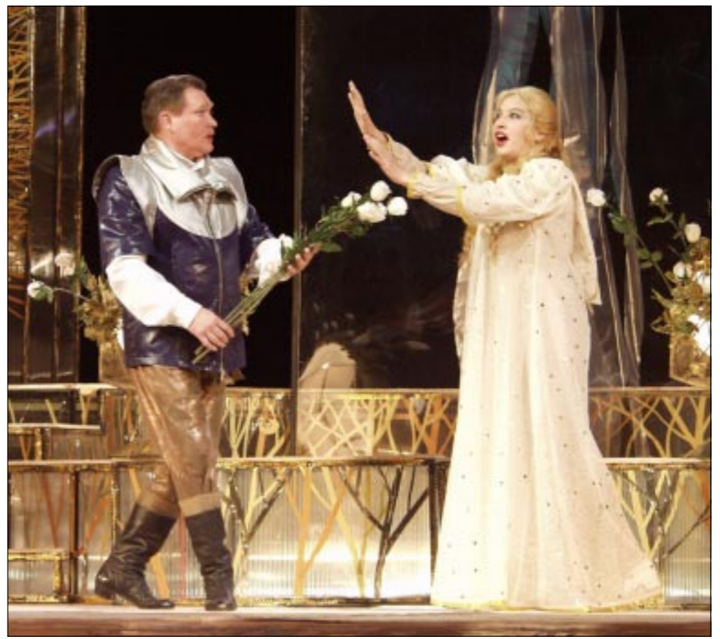
Премьера нынешнего сезона — опера «Иоланта» на сцене Воронежского театра оперы и балета.