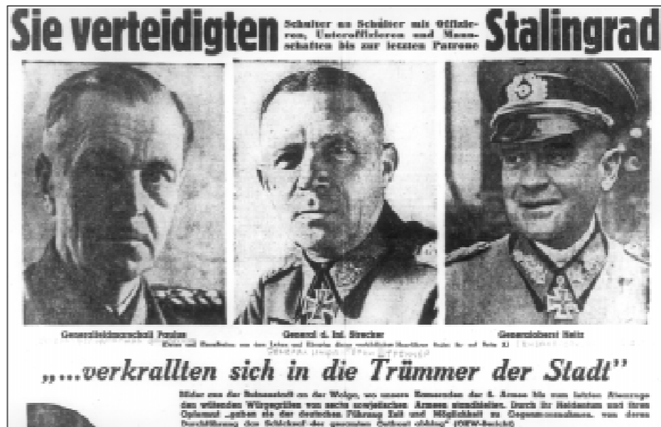
Сообщение в немецкой «Армейской газете» о гибели под Сталинградом генерал-фельдмаршала Паулюса, генералов Штреккера и Хайтца, которые в это время уже находились в советском плену.