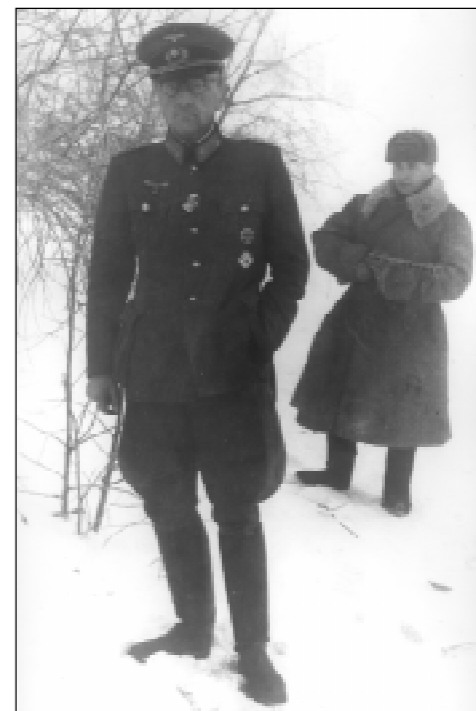
Пленный немецкий генерал Отто Ренольди на прогулке.