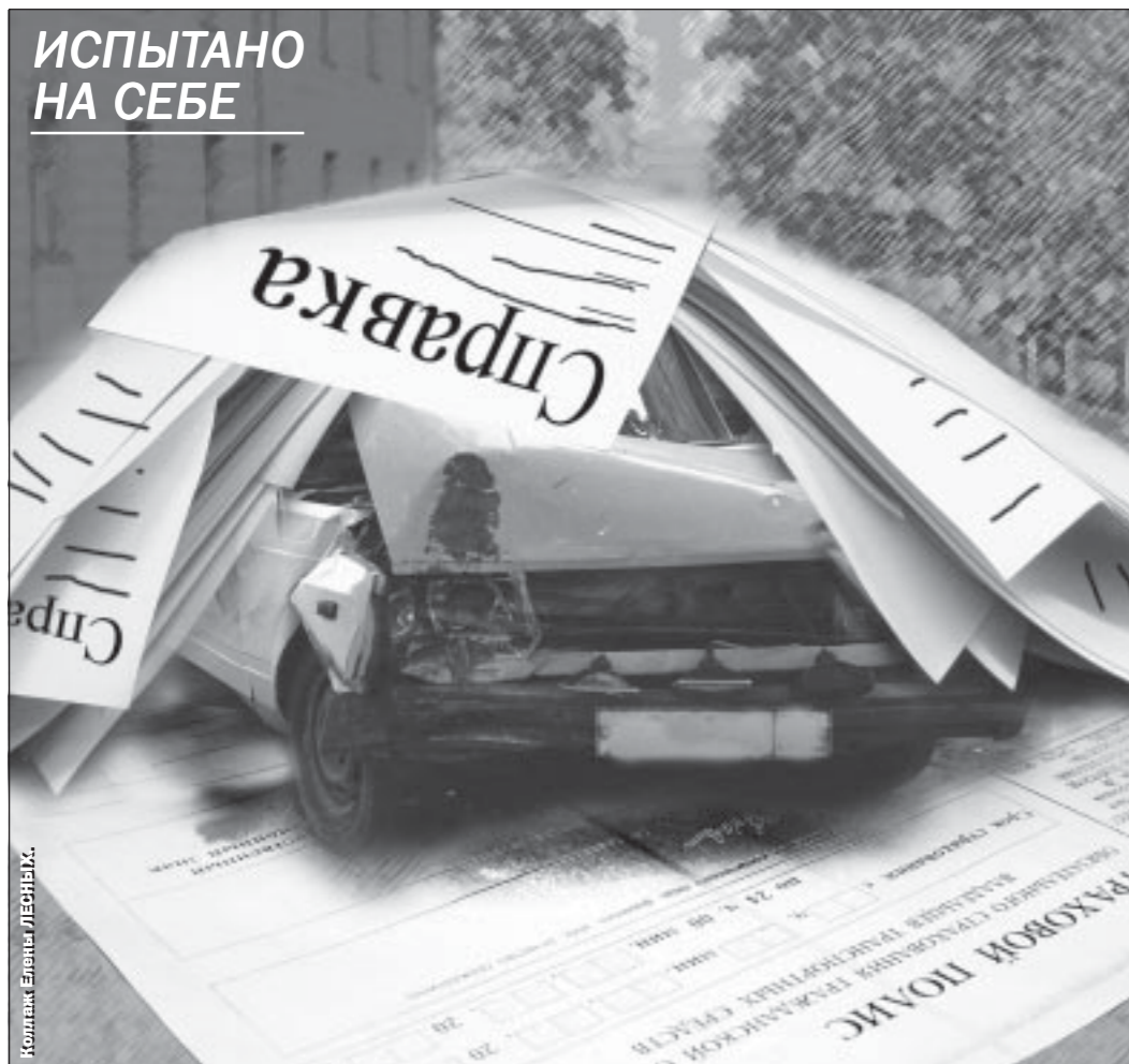
ИСПЫТАНО НА СЕБЕ