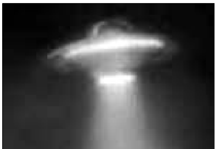
Практически каждый день Интернет приносит «сенсационные» сообщения о пришельцах с других планет, о летающих тарелках и т.д. и т.п. А посмотрите внимательно - и увидите: не тарелка это, а очередная «утка».