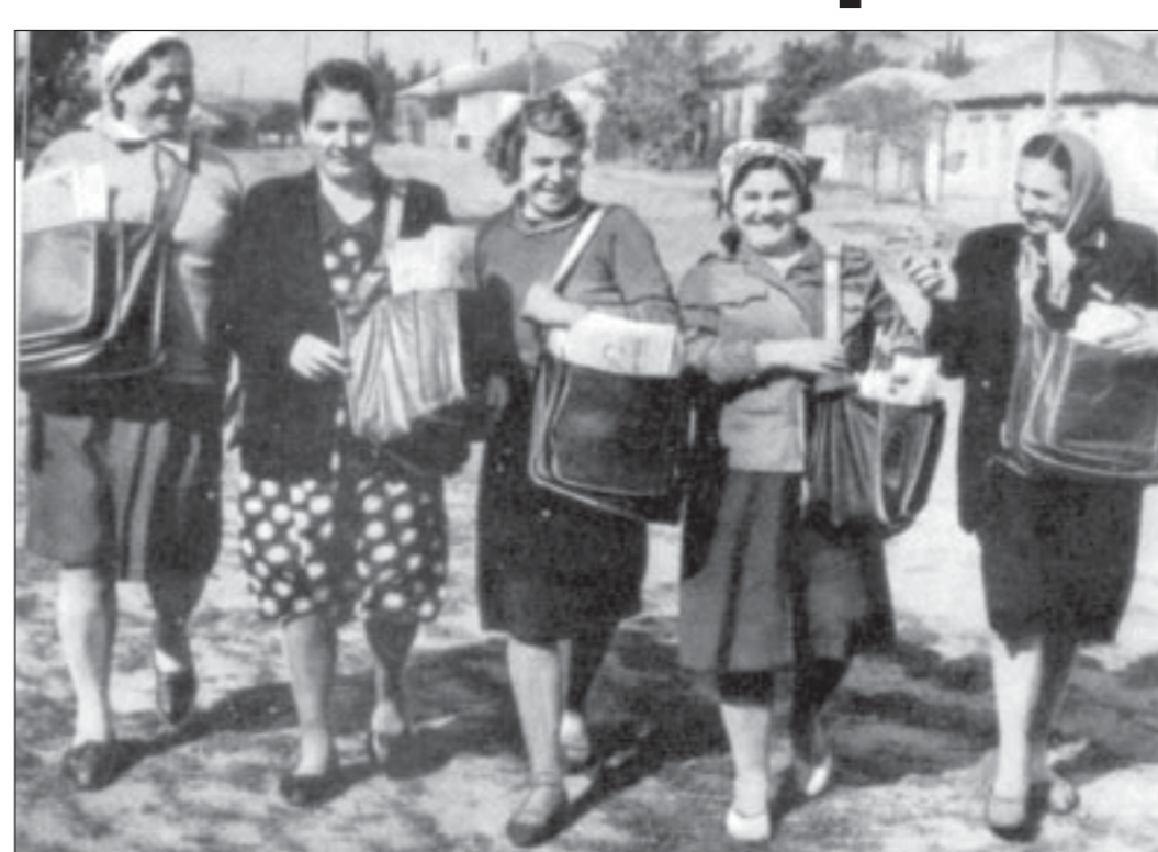
Вот столько газет и журналов в 1959 году доставляли почтальоны читателям Лушиновки, пригород Острогожска.

В Воронежском государственном университете прошел концерт артиста РСФСР дрессировщика Владимира Дурова.