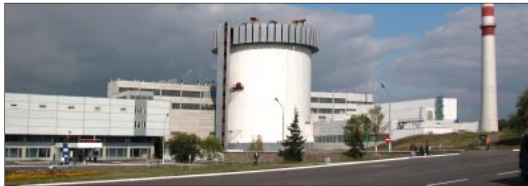
Пятый блок атомной станции.