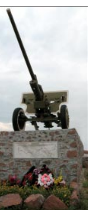
Воинский памятник в Верхнем Мамонте.

Через тройку дней он поведать корреспонденту: «В наши молодые годы Красная Армия была в чести. Послужить в ней хотелось каждому. Я уже женатый, дитя появилось, а тоже засобирались. Верхнемамонский военкомат мне отказ: нарушения зрения левого глаза. Тогда я по инстанции обратился в Калачевский, наш емо подчинялся, ну меня и забрали. В Шепетовке, что на Украине, прошел курсы младших командиров и получил назначение на поргрозастав под Польшу. Принял станковый пулемет, я — командир расчета. Доволен — во, кто я! Участвовал в кампании по воссоединению братьев — западных украинцев, чуть на войну с белофиннами не загремел, да в октябре 1940-го действительный срок вышел. Думал, приеду домой во всем командирском, а из округа — приказ: даже обмундирование третьей категории доставлять в части. Заявился домой во всем гражданском, потрепанном, вроде как и не служил. Когда война большая началась, сразу затребовал-