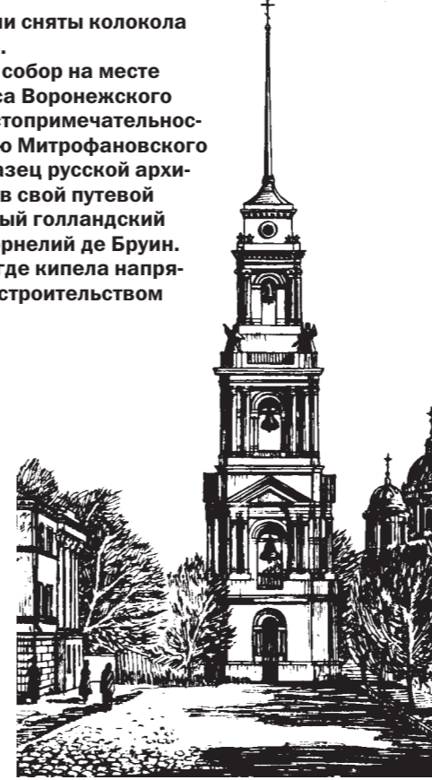
Такой была колокольня Митрофановского монастыря.