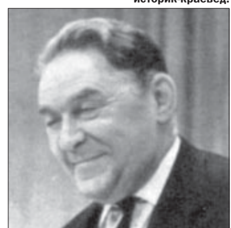
«Звезда» советской эстрады Леонид Утесов. Воронеж, 1959 год.