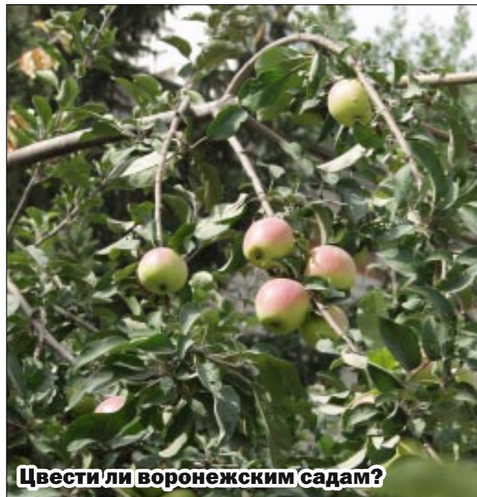
Цвети ли воронежским садам?