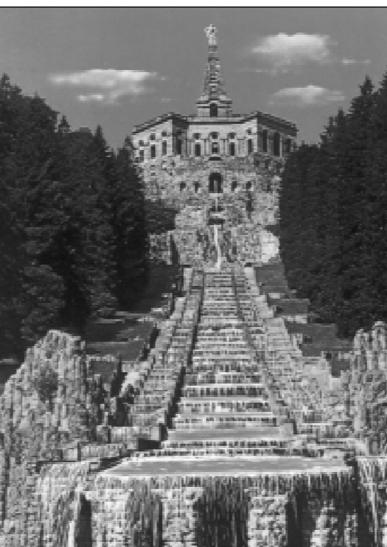
Памятник Геркулесу в Касселе.

Кассель — очень древний город. Он впервые упоминается в 913 году. История хранит имена его мно-