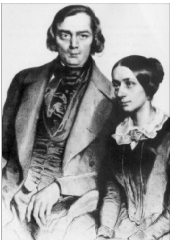
Роберт Шуман с женой Кларой.

Меня привлекла также бронзовая статуэтка Дюльетты Гвиччарди, той самой, которую считают «бессмертной возлюбленной» Бетховена. Некоторые исследователи полагают, что именно ей посвящено знаменитое любовное письмо, найденное уже после смерти композитора в потайном ящичке его стола.