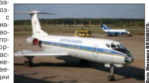
Сообщения подготовили: Дмитрий ДЕНИСЕНКО, Николай КАРДАШОВ, Сергей КРОЙЧИК.

У авиакомпании «Воронежавиа» открылся сайт: www.voronezhavia.ru Откройте его, вы узнаете о новостях в международном аэропорту «Воронеж», увидите текущее расписание вылетающих и прилетающих рейсов, информацию о вылетах и задержках. Вы ознакомитесь с правилами авиационных перевозок, получите полезную информацию для пассажиров, сможете почтить свежее публикация в СМИ.