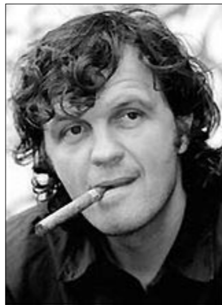
■ Эмир Кустурица.

лучивших две "Золотые пальмовые ветви") Эмир собрался экранизировать роман Иво Андрича "Мост над Дриной". Но как только стало ясно, что нет человека, готового финансировать этот проект на сербском языке, — отказался от своего замысла. Кстати, по языковой причине Кустурица не стал заниматься "Мастером и Маргаритой" — строптивый режиссер не мог себе представить бугарских героев говорящими по-английски. Не взялся он и за сюжет о секте русских духовников, живущих в Канаде, хотя несколько месяцев изучал их жизнь — понял, что это ему не близко и разорвал контракт. А нужную идею Кустурица нашел... в газетной заметке о торговле детьми югославскими цыганами. Так родилось широко известное в России "Время цыган".