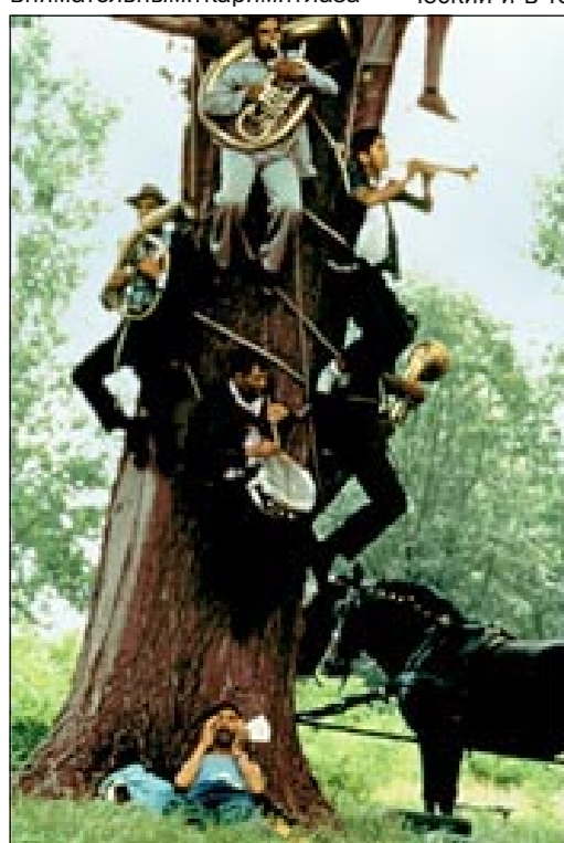
■ Кадр из фильма «Черная кошка, белый кот».

Впервые Эмир заставил говорить себе киношную общность на Венецианском кинофестивале в 1981 году. Никому неизвестный кудрявый юноша двадцати шести лет, с внимательными карими глаза-