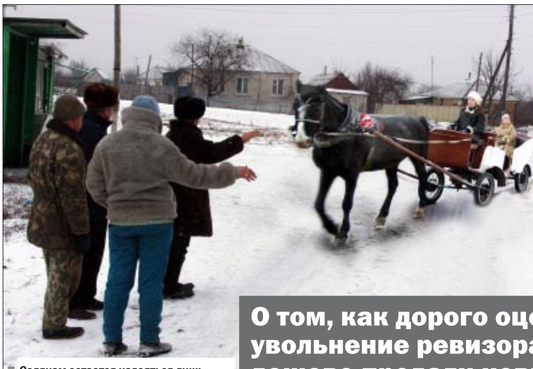
Селянам остается надеяться лишь на гужевой транспорт. Но вдруг и на него положат глаз судебные приставы?

О том, как дорого оценили увольнение ревизора и как дешево продали новые автобусы