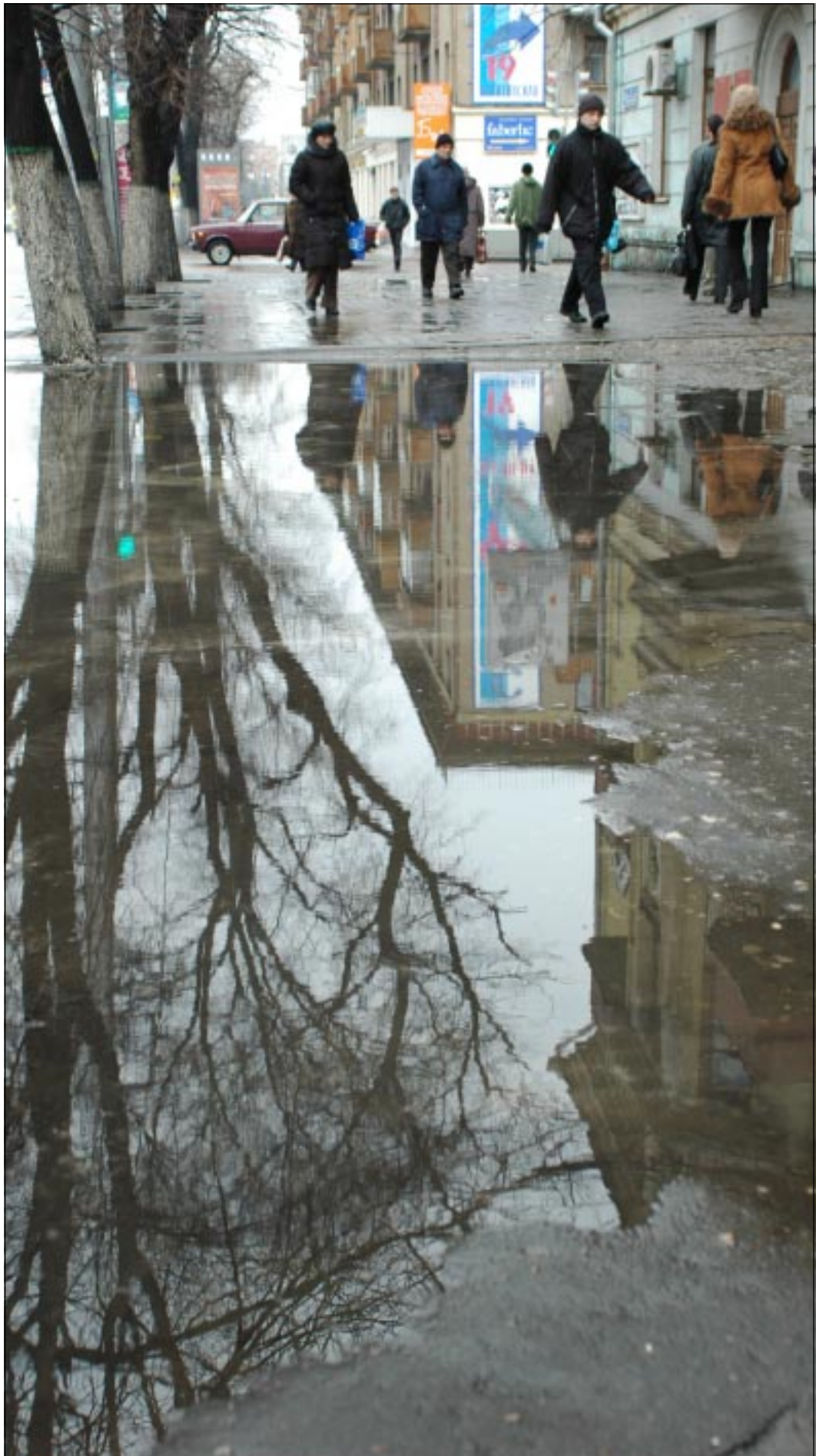
Воронеж: седьмой день зимы...