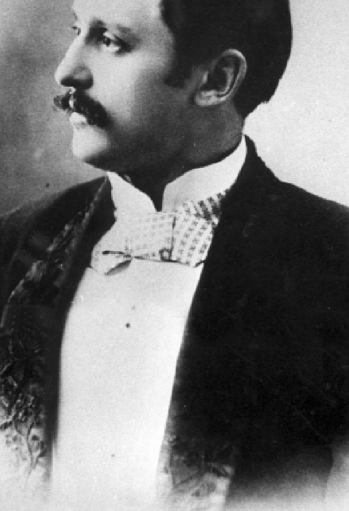
К началу сезона на рекламных щитах и афишах Москвы снова появилось его имя. И здание цирка на Цветном бульваре дрогнуло от аллодисментов в день первого представления, когда распорядитель в черном фраке объявил: — Оригинальный клоун Анатолий Дуров!

му не дал телеграммы? Где твоя собака? — Дуров взглянул на жену и опустился на диван, за круглый низкий столик. — Нет у меня теперь ни собаки, ни свиньи, ни барана, ни козла, ни осла... — Да что же, наконец, случилось? Где твои звери? — Погибли, сгорели. Все до одного, звери и птицы, — устало сказал Анатолий Леонидович. Лицо его покрывалось. — Живем сожгли моих зверей! Негодяи!.. Лучшие бы они меня в тюрьму посадили! Большими, постаревшим вернулся домой Анатолий Дуров. Не материальным крахом подкосил его. На своем трудном пути он привык получать удары и переживать потери. Трагическая гибель животных состарила его на несколько лет. Едва ли до этого случая он создавал, как сильно был привязан к своим четвероногим и пернатым друзьям. В кругу семьи он старался и не мог забыть кишиневский пожар. Всякий раз, вспоминая