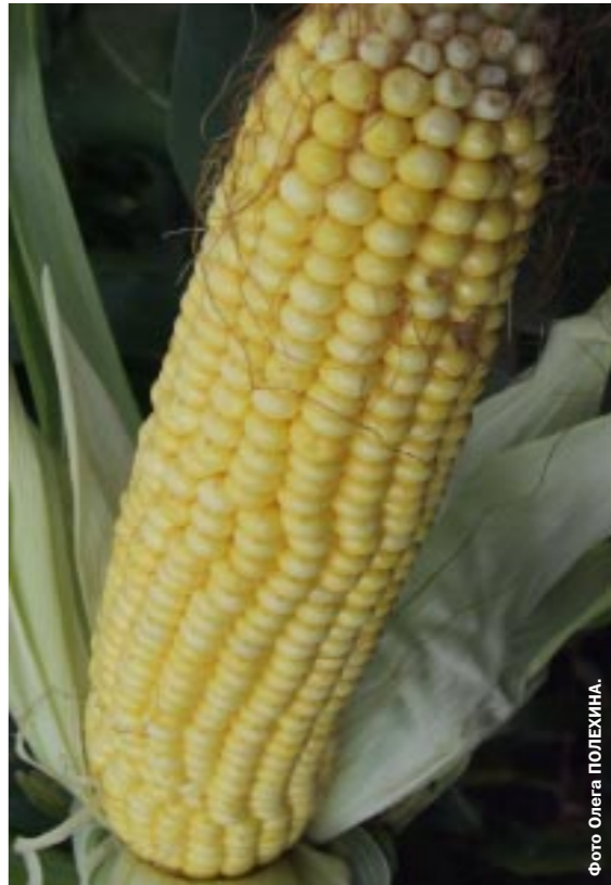
...На хлебном рынке в Россоши приличная конкуренция. Здесь продают батоны не только местных пекарей. Их возит из Воронежа, белгородской Алексеевки, из Старого Оскола. Спросите у любого встречного: чей хлеб вкуснее? Чаще вам ответят: - Наш, элеваторский! И по виду предприятие в городе самое заметное. Издалека виден громадный замок у железной дороги. Прописано оно в Россоши по улице Элеваторной, 2. Хоть семенное зерно той же «королевы-кукурузы, хоть муку и готовый хлеб вам доставят без посредников. Телефон-факс 2-29-66, справки по номеру -2-39-55. Код по Воронежской области 296, по России - 07396. (На правах рекламы).