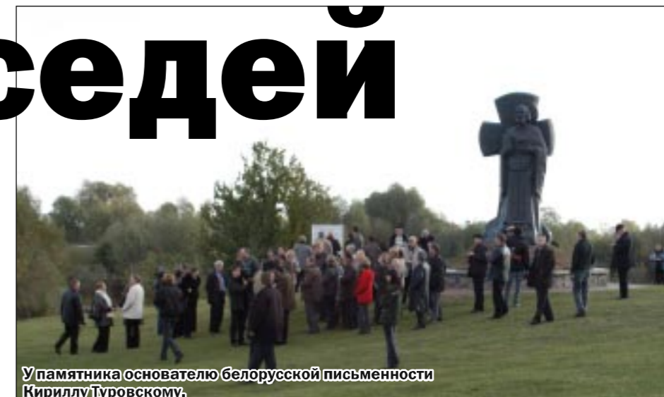
У памятника основателю белорусской письменности Кириллу Туровскому.

Это письмо редакция иллюстрирует фотографией с сайта www.kommuna.ru, где помещен фоточет о поездке российских журналистов в Белоруссию, о чем упоминает наша читательница.