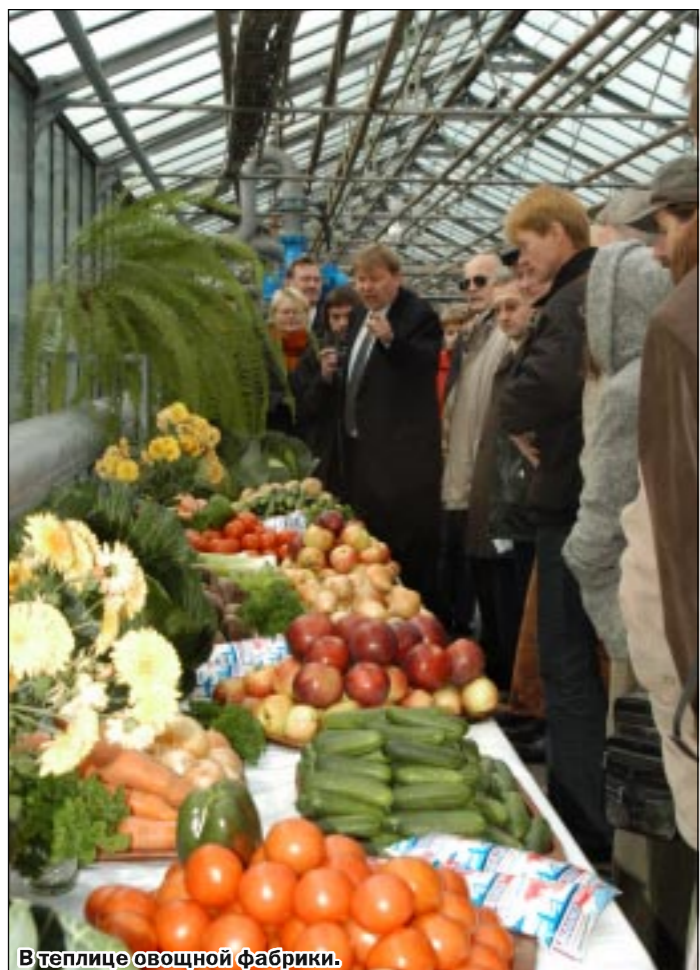
В теплице овощной фабрики.