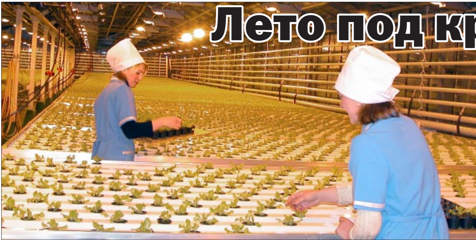
Из года в год СПК «Воронежский тепличный комбинат» занимает лидирующие позиции в России по выращиванию овощей и грибов в закрытом грунте.

Около 30 процентов площадей занимают томаты. Опыляются они шмелями – и это одно из доказательств экологической чистоты продукции. В рассадных отделениях теплиц выращивается широкий ассортимент богатых витаминами листовых и кочанных салатов, петрушки, сельдерея, укропа и редиса. Шампиньонный комплекс «Воронежского тепличного комбината» располагается на площади в 0,3 гектара и за год производит более 200 тонн грибов. Есть консервный цех, который производит более 20 наименований маринованной продукции... Работа с защищенным грунтом считается одной из наиболее сложных в сельскохозяйственном производстве – здесь и важность поддержания постоянной температуры, и агрохимическая защита. Более 1000 человек трудится сегодня на передовом предприятии.