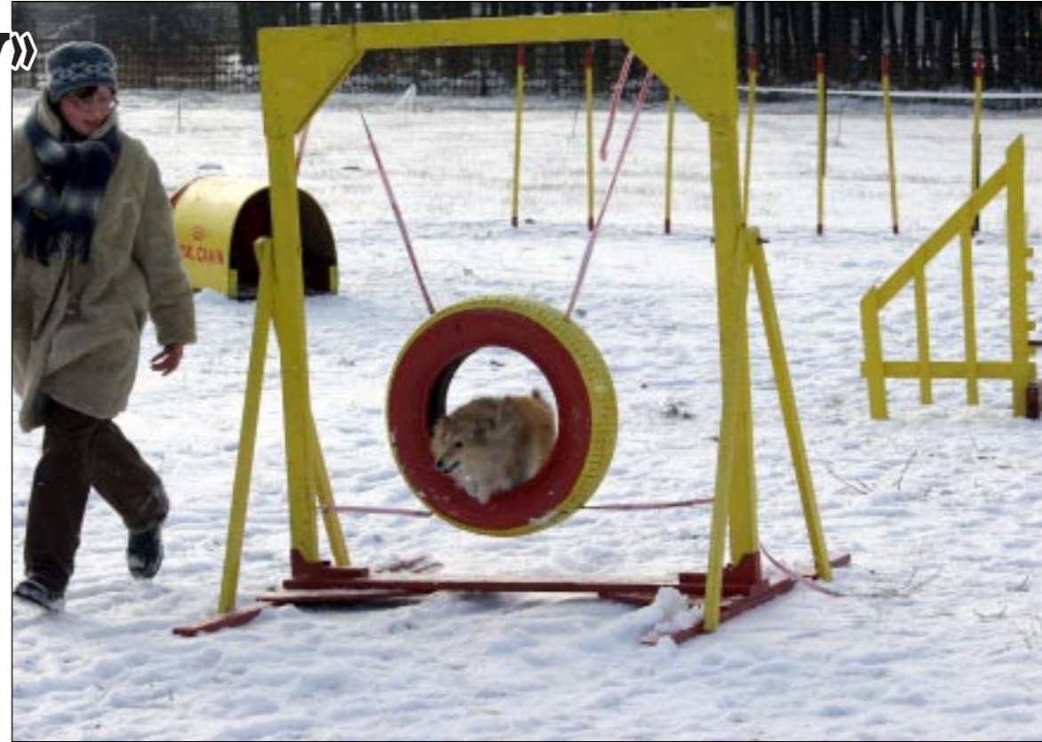
Сергей КОЛЕСНИКОВ. Фото автора.