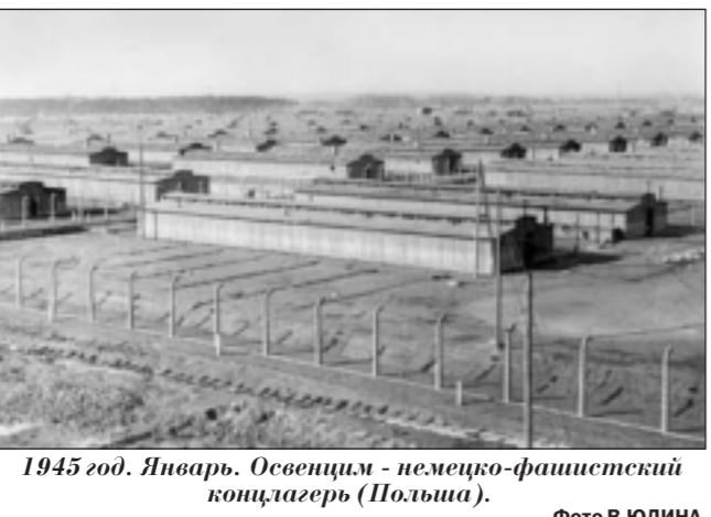
1945 год. Январь. Освенцим - немецко-фашистский концлагерь (Польша).