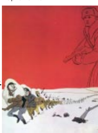
Обратный путь. 1944 год. Кукрыниксы.

Музыка: Н. Богословский. Слова: Е. Долматовский. Из к/ф «Александр Пархоменко».