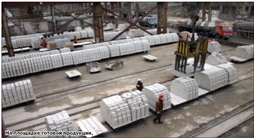
На площадке готовой продукции.