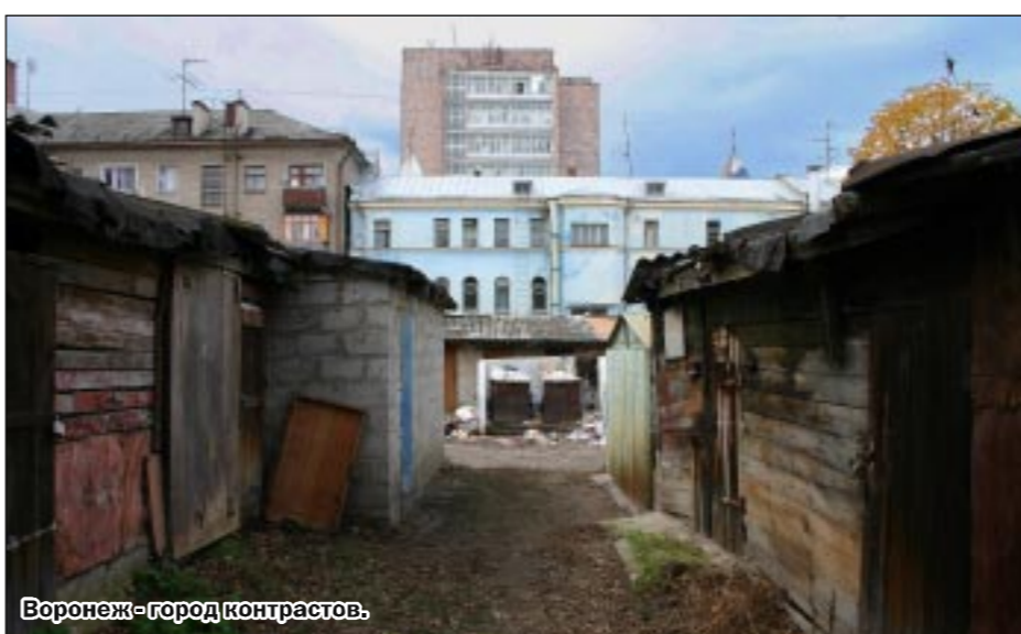
Воронеж — город контрастов

Информационный отдел Управления по охране окружающей среды города Воронежа.