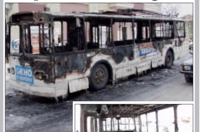
Вчера в Воронеже около Кольцовского сквера практически полностью выгорел троллейбус маршрута №4. ЧП произошло в 9.36 по московскому времени.