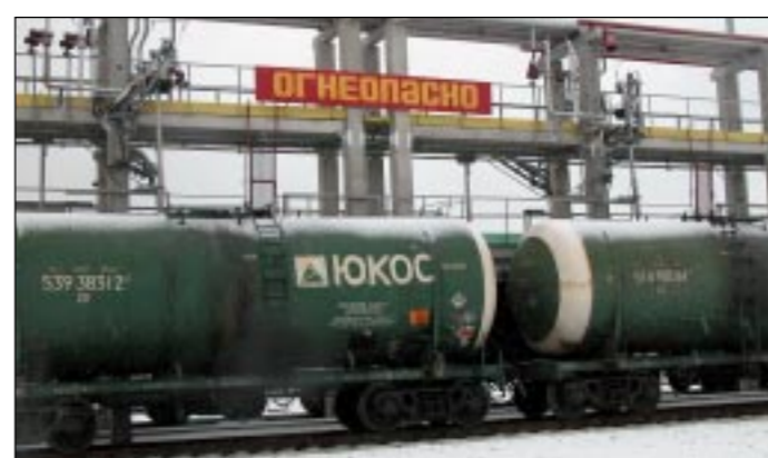
Вид терминала «Лиски-2».

«Компания может работать и поставлять нефть и нефтепродукты своим традиционным потребителям как в стране, так и за рубежом. А мы будем делать всё для того, чтобы развитие шло вверх и вперед», — подчеркнул председатель Совета директоров нефтяной компании ЮКОС Виктор Герашенко, сделав ссылку при этом на слова Президента России о том, что, несмотря на налоговые претензии, «не ставится задача банкротства компании». Как уже сообщала «Коммуна», 21 января Виктор Герашенко принял участие в церемонии торжественного открытия крупнейшей в России нефтеналивной эстакады на терминале «Лиски-2», что в Лискинском районе Воронежской области. Ввод ее в эксплуатацию позволил максимально уменьшить путь нефтепродукта от завода до конечного потребителя.