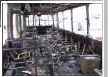
Причиной возгорания явилась техническая неисправность в кабине водителя. Короткое замыкание и троллейбус задымил. Человеческих жертв удалось избежать, поскольку водитель своевременно выпустил пассажиров из салона. Тушение осуществлялось двумя пожарными расчетами. Как сообщили нам в пресс-службе ГО и ЧС области, огнеборцам понадобилось всего девять минут, чтобы справиться с огнем. За последние несколько лет это первый случай, когда горит городской электротранспорт. Аналогичные примеры есть, но в других крупных городах. Так, в октябре 2003 года в столице на Бережковской набережной также сгорел троллейбус и тоже обошлось без человеческих жертв.

Сергей КРОЙЧИК