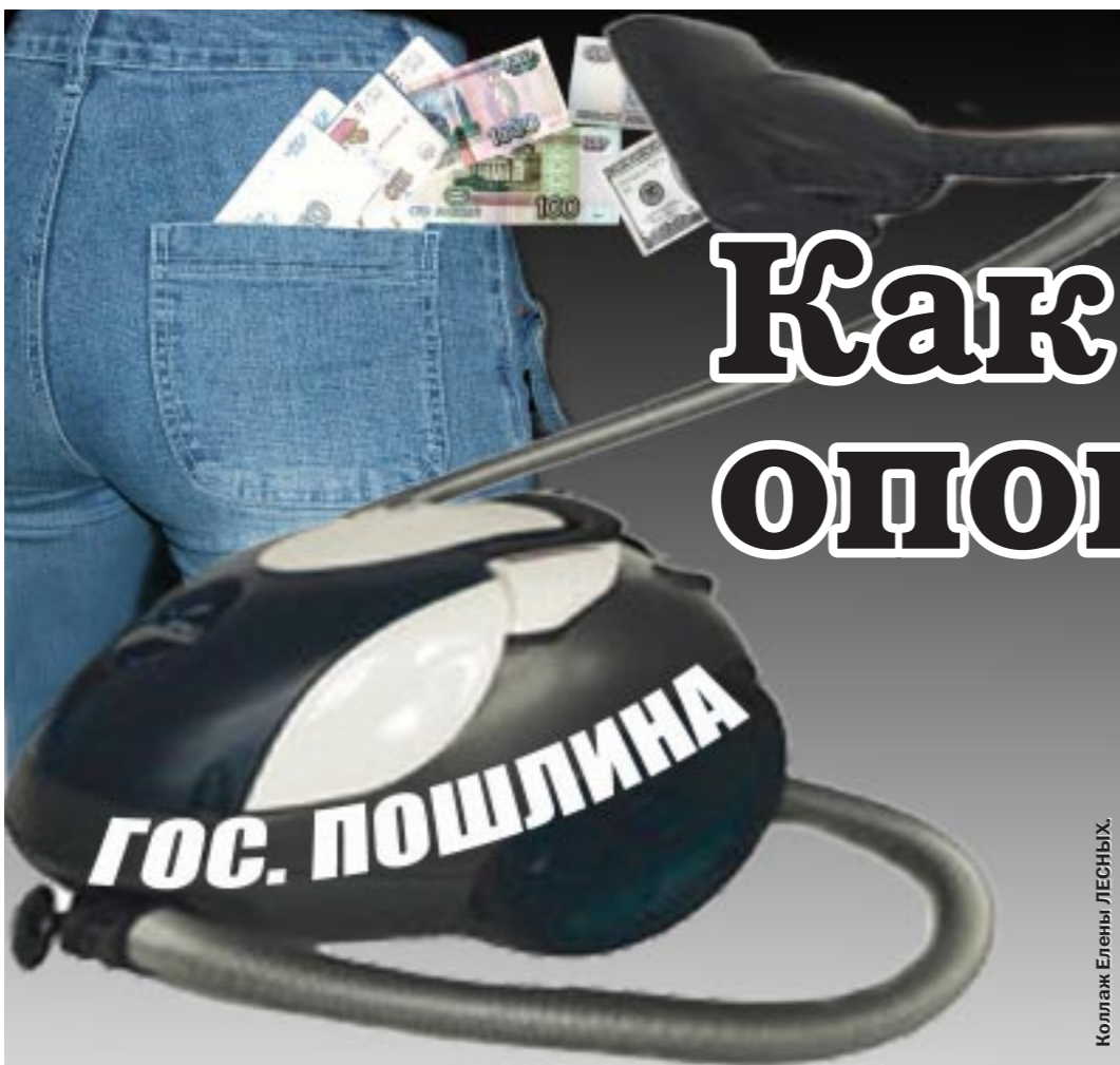
Коллаж Елены ЛЕСНЫХ