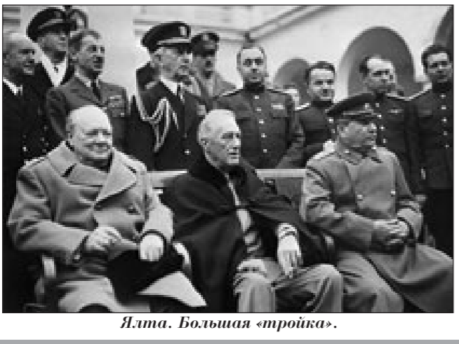
Ялта. Большая «тройка».

С 4 по 11 февраля 1945 года в Ялте проходила Крымская (Ялтинская) конференция глав правительств 3 союзных держав во Второй мировой войне: Сталина (СССР), Рузвельта (США) и Черчилля (Великобритания). На этой конференции были определены и согласованы военные планы союзных держав и намечены основные принципы их послевоенной политики с целью создания прочного мира и системы международной безопасности; участники конференции заявили о своей цели уничтожить германский милитаризм и нацизм; были приняты решения о создании в Германии зон оккупации трех держав (а также Франции, в случае ее согласия) и общегерманского контрольного органа союзных держав, о взыскании с Германии репараций, о создании ООН. СССР выразил согласие на определенных условиях вступить в войну против Японии через 2-3 месяца после окончания войны в Европе.