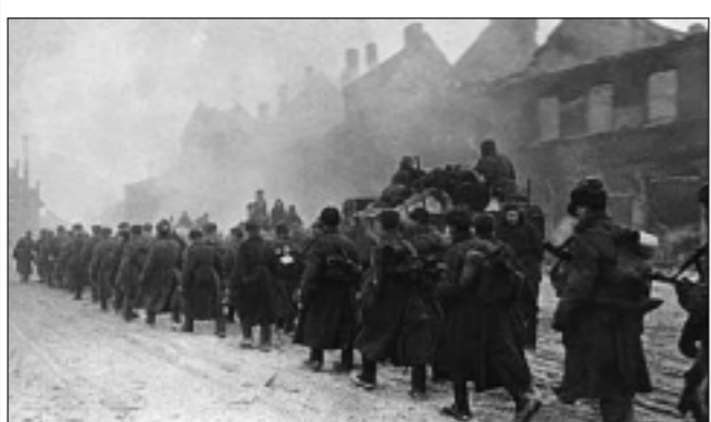
1945 год. Части Советской Армии движутся к Кёнигсбергу.