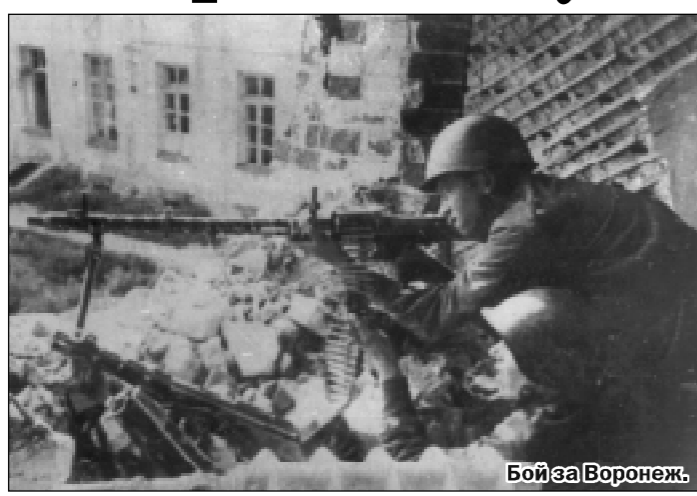
Бой за Воронеж.