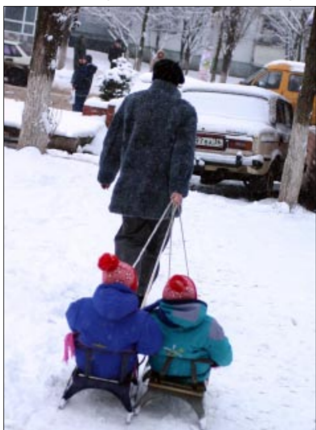
Самый надежный зимний транспорт.