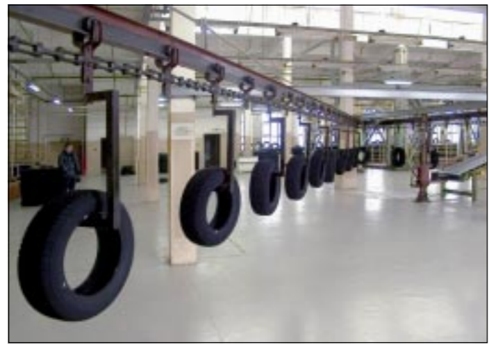
На снимках: слева - шинный завод сегодня; справа - продукция РАСКО: объемы растут.

...Безусловно, упрочение доверия инвесторов, принимающих участие в развитии экономики и социальной сферы области, и улучшение ее инвестиционного климата стали результатом кропотливого труда администрации области, высшего представительного и законодательного органа - Думы. Но впереди еще много работы, поступательное движение вперед исключает остановки. Для того, чтобы дойти до цели, нужно, прежде всего, идти.