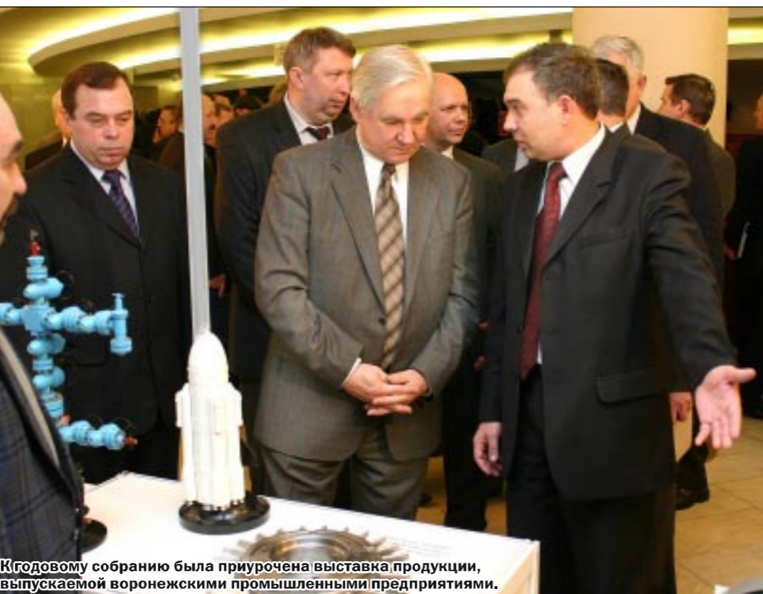
К годовому собранию была приурочена выставка продукции, выпускаемой воронежскими промышленными предприятиями.