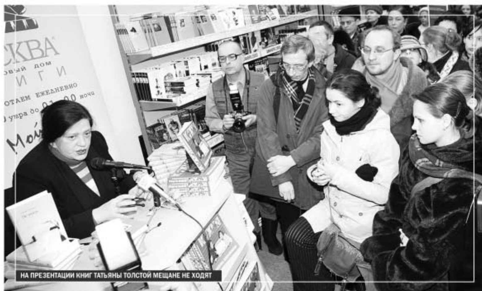
НА ПРЕЗЕНТАЦИИ КНИГ ТАТЬЯНЫ ТОЛСТОЙ МЕШАНЕ НЕ ХОДЯТ

ПОПУЛЯРНАЯ ПИСАТЕЛЬНИЦА И ОДНА ИЗ ВЕДУЩИХ ТЕЛЕПРОГРАММЫ «ШКОЛА ЗЛОСЛОВИЯ» ТАТЬЯНА ТОЛСТАЯ ГОВОРИТ ОБО ВСЕМ НА СВЕТЕ, КРОМЕ СВОИХ ПРОИЗВЕДЕНИЙ