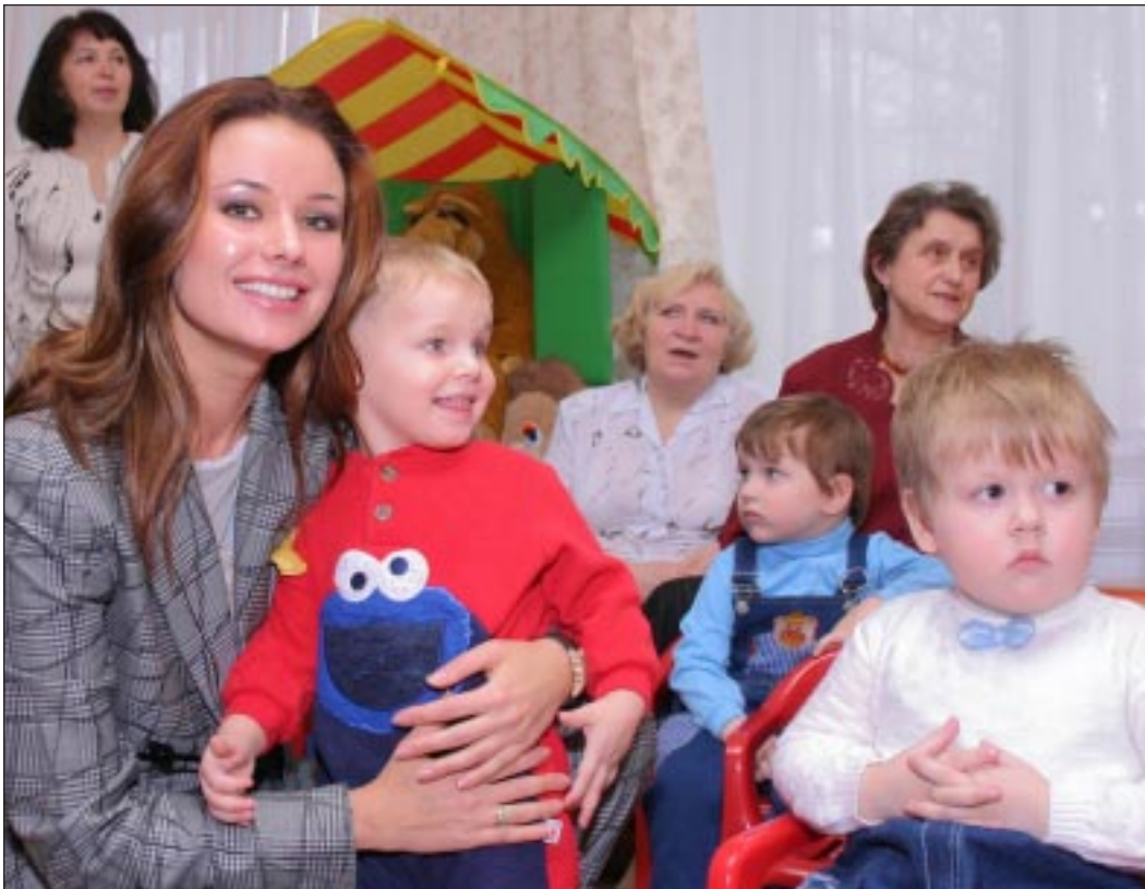
Федоровой, и у него даже есть ее фотография...

Ого! Сразу вспоминаются цитаты из «желтых» газет: «Оксана Федорова неравнодушна к Председателю Совета Федерации Сергею Миронову, потому и выбрала Партию жизни», «Президент Путин - тайный президент