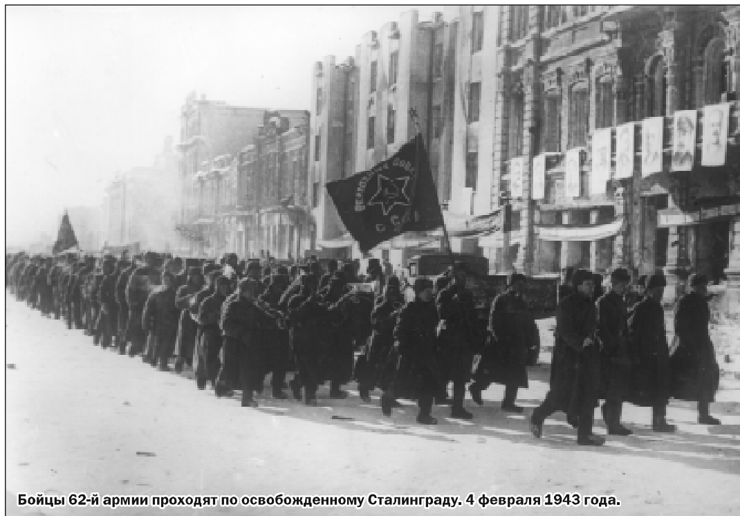
Бойцы 62-й армии проходят по освобожденному Сталинграду. 4 февраля 1943 года.

ны все боеприпасы, части дивизии начали выходить из окружения. С боем прорвав окружение на реке Оскол, дивизии группами на протяжении 110 км пробивались к своим в район Коршево. О том, насколько тяжелым был выход из окружения, свидетельствует такой факт: когда 29 июля закончился сбор дивизии, то состав ее оказался следующим: старшего командачастова - 40 человек, среднего - 108 человек, младшего - 71 человек, рядового - 257 человек, то есть всего 456 человек. Таким образом, уже в боях на дальних подступах к Воронежу тысячи воронежцев отдали свою жизнь, защищая родной город в составе 45-й стрелковой дивизии.