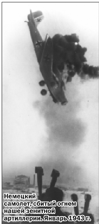
Немецкий самолет сбитый огнем нашей зенитной артиллерии. Январь 1943г.

3 июля противник прошел двумя клиньями с флангов дивизии, и полуокружение превратилось в полное окружение; более того, части дивизии оказались в двойном окружении - по реке Оскол и по реке Дон. Ведя бои в окружении, части дивизии истребили свыше 5000 вражеских солдат и офицеров, уничтожили эскадрон конницы, много техники и вооружения врага. Только после того, как были израсходова-