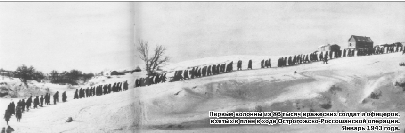
Первые колонны из 86 тысяч вражеских солдат и офицеров, выйдя в плен в ходе Острожско-Россошанской операции. Январь 1943 года.