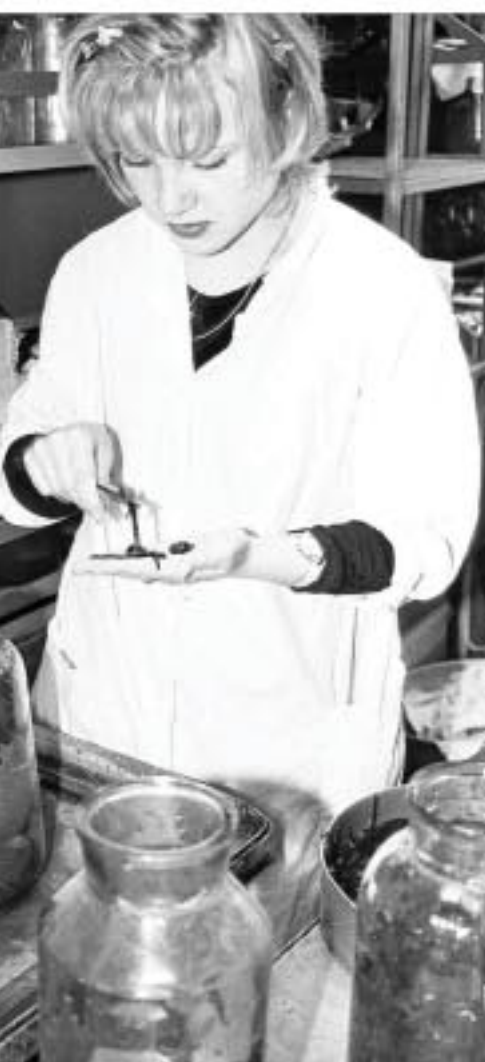
ВОТ ОНИ — НАШИ СКРОМНЫЕ ВРАЧЕВАТЕЛИ

полную лечебных ферментов, должно пройти около полугода. — За время сеанса пиявка высасывает у вас около 15 миллилитров крови, бинтуя мне руку. — Примерно столько же крови вытекает и после сеанса, ведь в слюне пиявки содержится фермент, не дающий крови сворачиваться. След тройных челюстей напоминат эмблему «Мерседеса». Несмотря на то, что рана была маленьким укусом, повязку мне наложил как при осколочном ранении. Но мое душевное самочувствие после сеанса было просто превосходным. Оказывается, в ответ на агрессию пиявки человеческий организм выделяет так называемые эндорфины — гормоны счастья. Словом, ради отличного настроения стоило пролить немного крови.