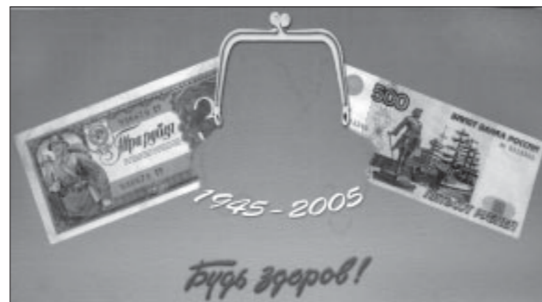
Работа В.Гомозова (Воронеж).

Пресс-центр администрации Воронежской области.