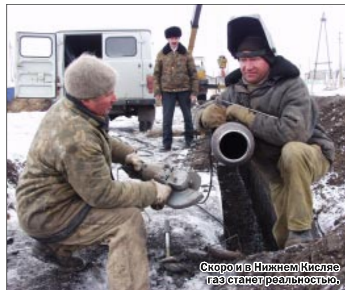
Скоро и в Нижнем Кисляе газ станет реальностью.

Так из метров складываются километры, из километров — целые магистрали. В прошлом году в зоне ответственности управления «Бутурлиновкамежрайгаз» построено